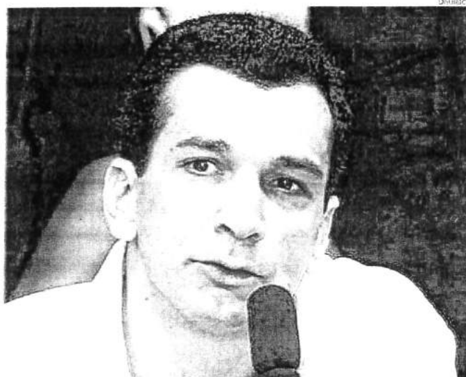
Marcola, mesmo preso em Presidente Bernardes, lidera facção com seguidores no Maranhão