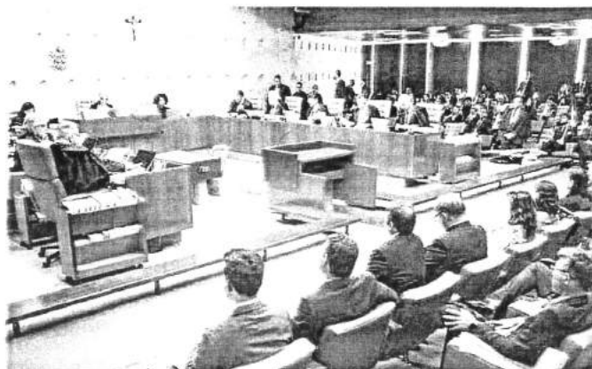
Ministros do STF se dividiram quanto à legalidade da condução, prática disseminada pela Polícia Federal

O assunto já estava sendo debatido desde 6 de junho, quando o ministro relator Gilmar Mendes votou contra a prática, por considerá-la