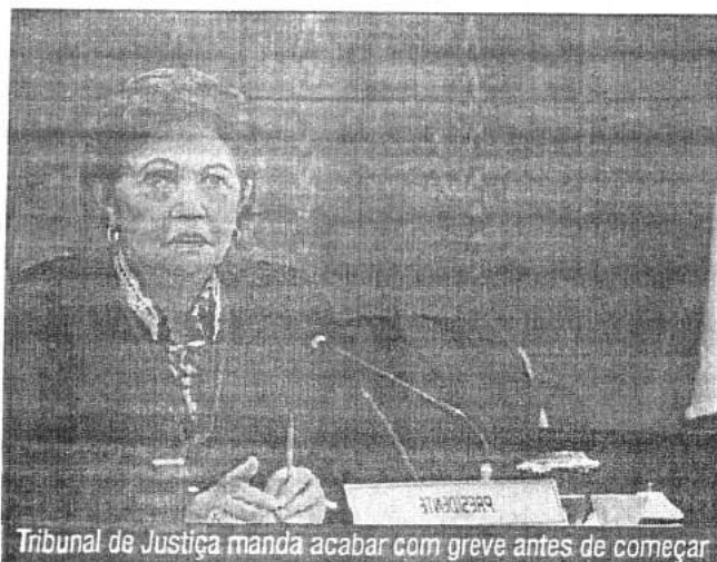
Tribunal de Justiça manda acabar com greve antes de começar

A decisão estipulou ainda que a greve deveria ser suspensa no prazo de 24 (vinte e quatro) horas, fixando multa diária de R$20.000,00 (vinte mil reais) para o caso de descum-