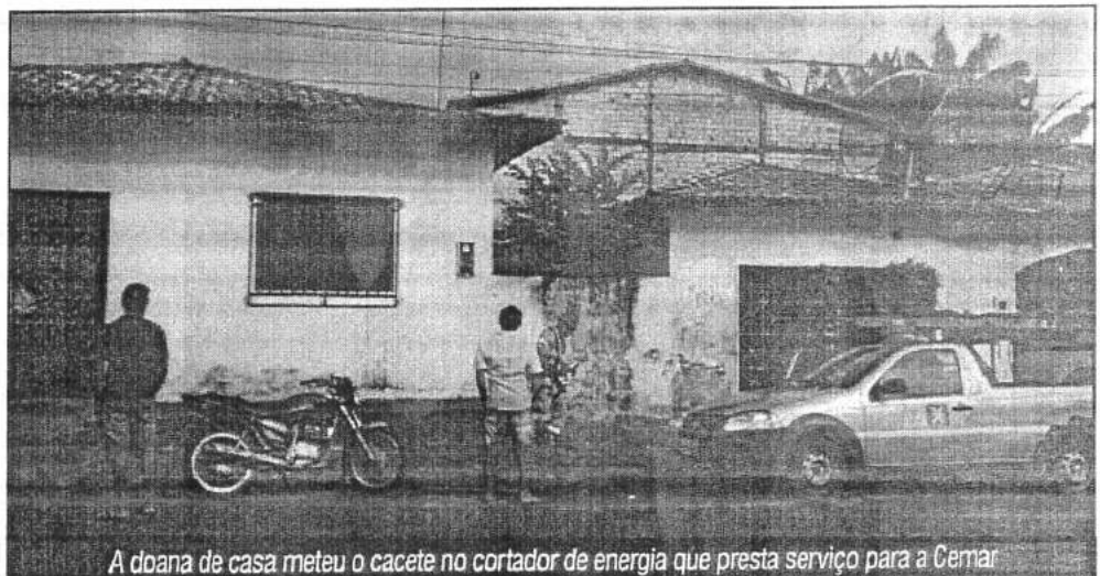
A dona de casa meteu o cacete no cortador de energia que presta serviço para a Cemar

O eletricista agredido registrou ocorrência e foi orientado a realizar o exame de corpô delito no Instituto Médico Legal (IML). Na delegacia ele disse ao delegado que tentava realizar o corte luz de uma residência na Cidade Olímpica, por falta de pagamento, quando foi surpreendido pela dona do imóvel que o atacou, desferindo vários golpes pelo corpo com um pedaço de pau.