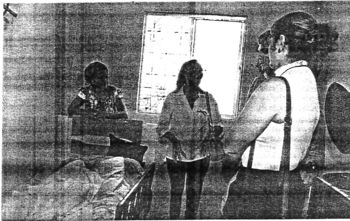
Representantes dos órgãos de defesa dos direitos das pessoas idosas em visita à residência na qual haveria cárcere privado de uma senhora de 92 anos