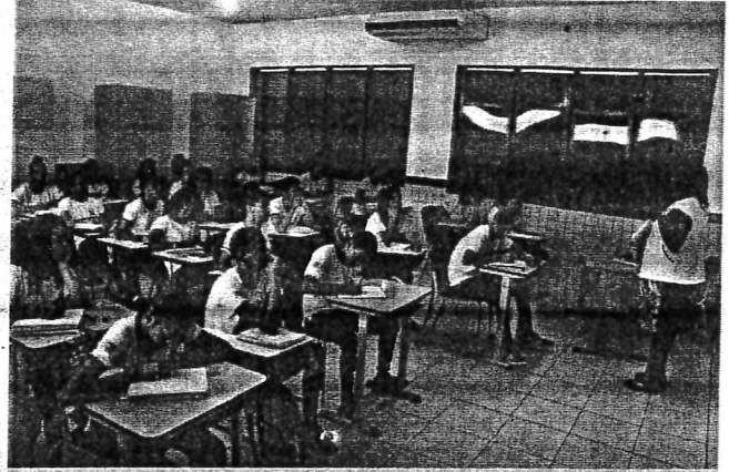
Candidatos classificados devem se apresentar nas Unidades Regionais de Educação

Outros documentos necessários são: comprovante de aptidão física e mental apurada em perícia médica (laudo);