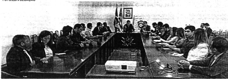
Gestores da Seap reúnem-se com representantes do Conselho de Política Penitenciária na Casa Civil