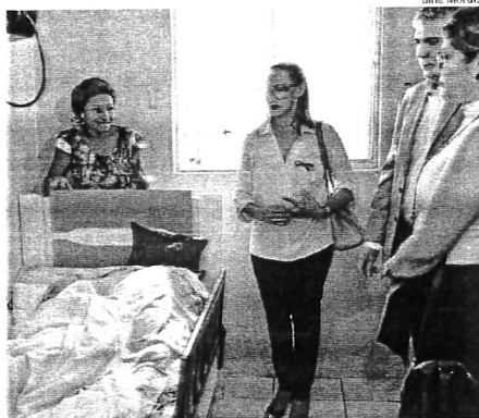
Representantes de órgãos de defesa do idoso durante visita ontem

“Nós vamos marcar uma audiência com a família dessa idosa