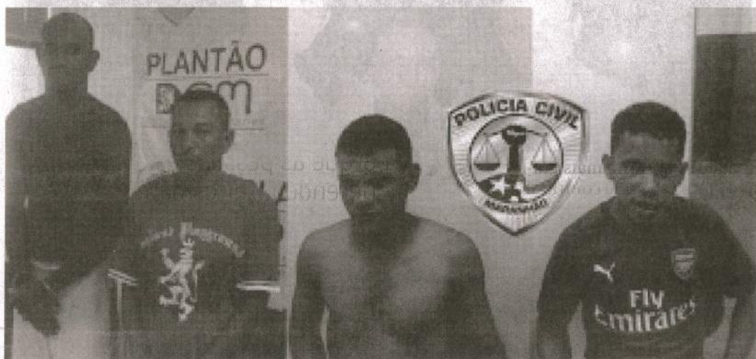
Quatro dos seis mandados de prisão foram cumpridos logo às primeiras horas da manhã de segunda-feira