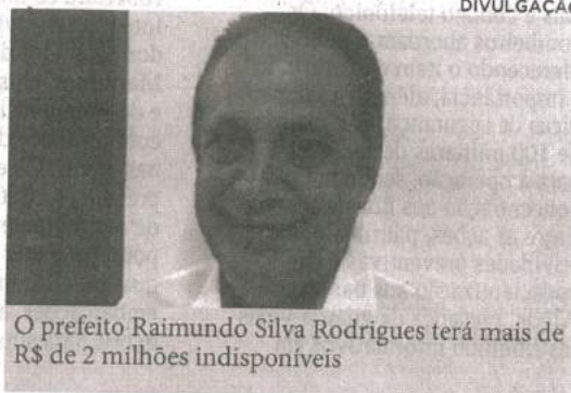
O prefeito Raimundo Silva Rodrigues terá mais de R$ de 2 milhões indisponíveis

Para a juíza, a medida de indisponibilidade de