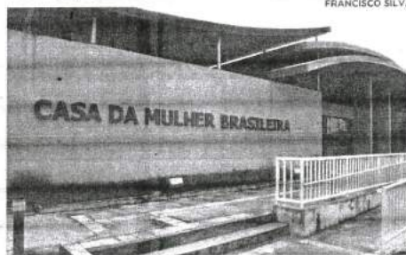
Localizada no Jaracaty, a Casa da Mulher Brasileira funciona 24 horas, com diversos serviços

No dia 14 de novembro do ano passado, foi iniciado o funcionamento da Casa da Mulher Brasileira, que atende casos de violência doméstica, estupro entre outros crimes de gênero sofridos por esse segmento. A unidade, localizada no Jaracaty, reúne diversos órgãos e entidades de referência do Município, Estado, Justiça e Sociedade Civil Organizada. A casa funciona todos os dias, 24 horas. A Casa da Mulher Brasileira conta com atendimento humanizado com salas de acolhimento, recepção, abrigo de passagem com alojamentos, brinquedoteca e demais dependências. Atende casos de violência doméstica familiar, casos de estupro, e faz encaminhamento aos órgãos de referência. Promove, ainda, ações de geração de emprego e renda, a partir dos serviços do Sine Mulher