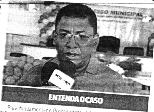
ENTENDA O CASO

O valor do contrato firmado com a CTSZL foi de R$