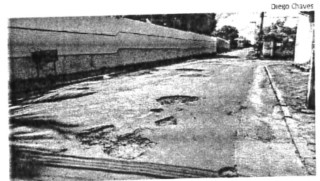
Buracos na Rua Alexandria, no Jardim Eldorado, causam transtornos

Fluxo intenso de grandes veículos pode ser causa do problema, que causa prejuízos