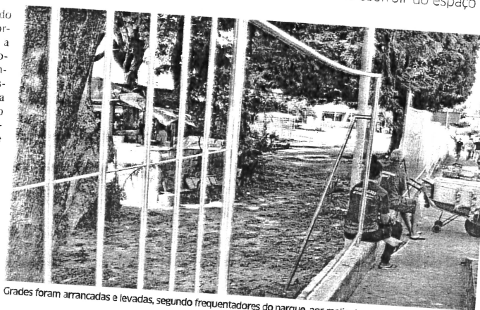
Grades foram arrancadas e levadas, segundo frequentadores do parque, por meliantes que cometem assaltos

Outro exemplo está na oferta de abrigos de ônibus. Recentemente, a Prefeitura de São Luís