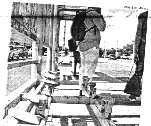
Bancos do abrigo foram destruídos, na Av. Luiz Eduardo Magalhães

No local, o telefone foi retirado, restando apenas a caixa para ligação e o fio que conectava o telefone à caixa de ligação. A manutenção dos orelhões é feita