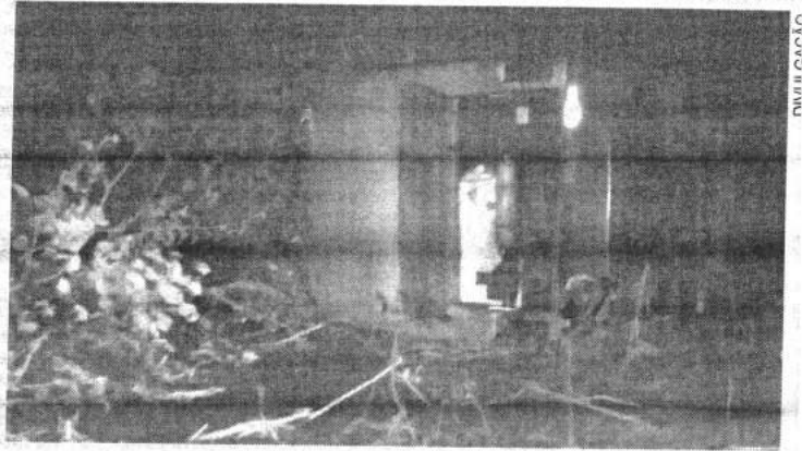
Estado em que ficou o ônibus que tombou e causou duas mortes

Segundo informações, o condutor do veículo menor evadiu-se após o acidente. Outras 12 pessoas saíram feridas e foram levadas para o Hospital Regional de Presidente Dutra. Os demais foram transportados para Bacabal em um ônibus cedido pela Prefeitura de Barra do Corda.