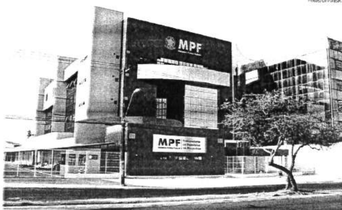
Procuradoria Regional Eleitoral do Maranhão atua na sede do Ministério Público Federal, na Areinha

que se destina à orientação de padres, sacerdotes, clérigos, pastores, ministros religiosos, presbíteros, episcopos, abades, vigários, reverendos, bispos, pontífices ou qualquer representante religioso, leva em consideração o entendimento, firmado pelo Tribunal Superior Eleitoral (TSE), de que a propaganda eleitoral em prol de candidatos feita por entidade religiosa, ainda que de modo velado, pode caracterizar abuso de poder econômico e, por isso, deve ser uma prática vedada.