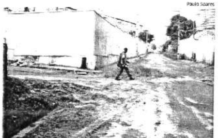
Via não tem asfalto, e lama em buracos prejudica motoristas e pedestres

O Estado manteve contato com a Prefeitura de São José de Ribamar e, por meio de nota, a Secretaria de Recuperação da Malha Viária, Prédios e Logradouros Públicos (Semavi), informou que tem executado serviços de melhoria do revestimento primário na Rua Santa Maria e outras vias da Maiobinha. ●