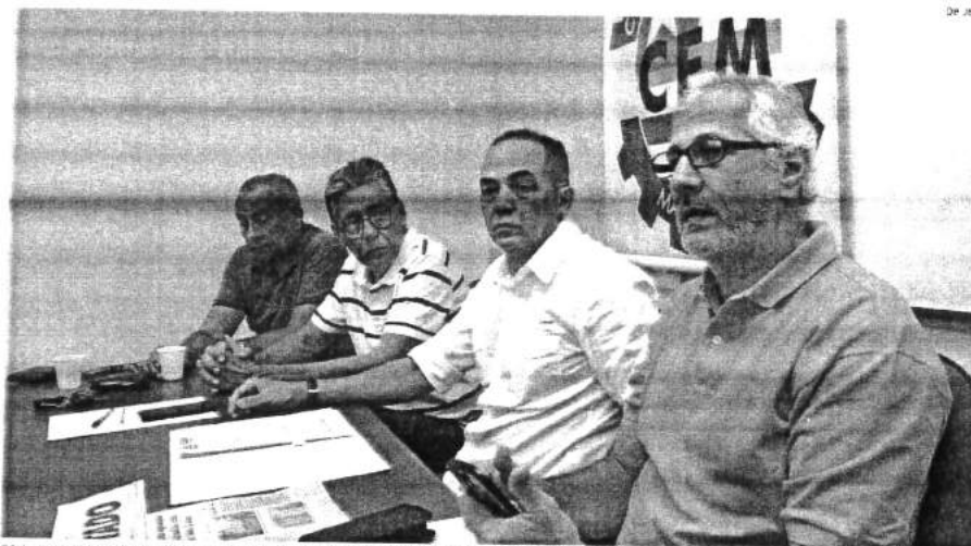
Dirigentes do Clube de Engenharia alertaram ontem sobre riscos em prédios de São Luís: CEM manifesta preocupação com novo Plano Diretor

Conselho de Engenharia do Maranhão elaborou e encaminhou documento para entidades ligadas à segurança de prédios em São Luís e aguarda resposta