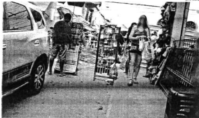
Ambulantes permanecem nas vias transversais da Rua Grande durante a obra de reestruturação na área