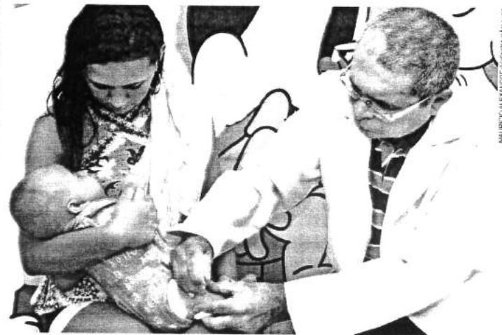
Público prioritário são crianças de um ano a menores de cinco anos para atingir a meta

"Há duas décadas não há registro de casos dessas doenças em São Luís. Por isso, é muito importante que os pais atentem para o comparecimento de seus filhos que estão dentro da faixa etária atendida pela campanha, pois tanto o sarampo como a poliomielite são doenças graves que podem ocasionar sequelas muitas vezes irreversíveis. Portanto, o caminho é a prevenção. Para isso, nós estruturamos todas as nossas