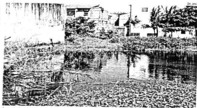
Água de chuva se acumula em terreno baldio no bairro Areinha; local é propício à proliferação do Aedes aegypti

A redução da média de casos de doenças relacionadas ao Aedes , de