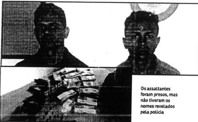
Os assaltantes foram presos, mas não tiveram os nomes revelados pela polícia

Duas armas e uma grande quantidade em dinheiro foram apreendidas. Após os procedimentos cabíveis, os assaltantes devem ser encaminhados para o Complexo Penitenciário de Pedrinhas, onde ficarão à disposição da Justiça.