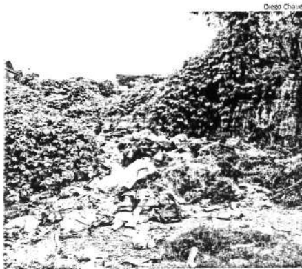
Lixo e mato se acumulam no terreno onde foi demolido o prédio da Cobal