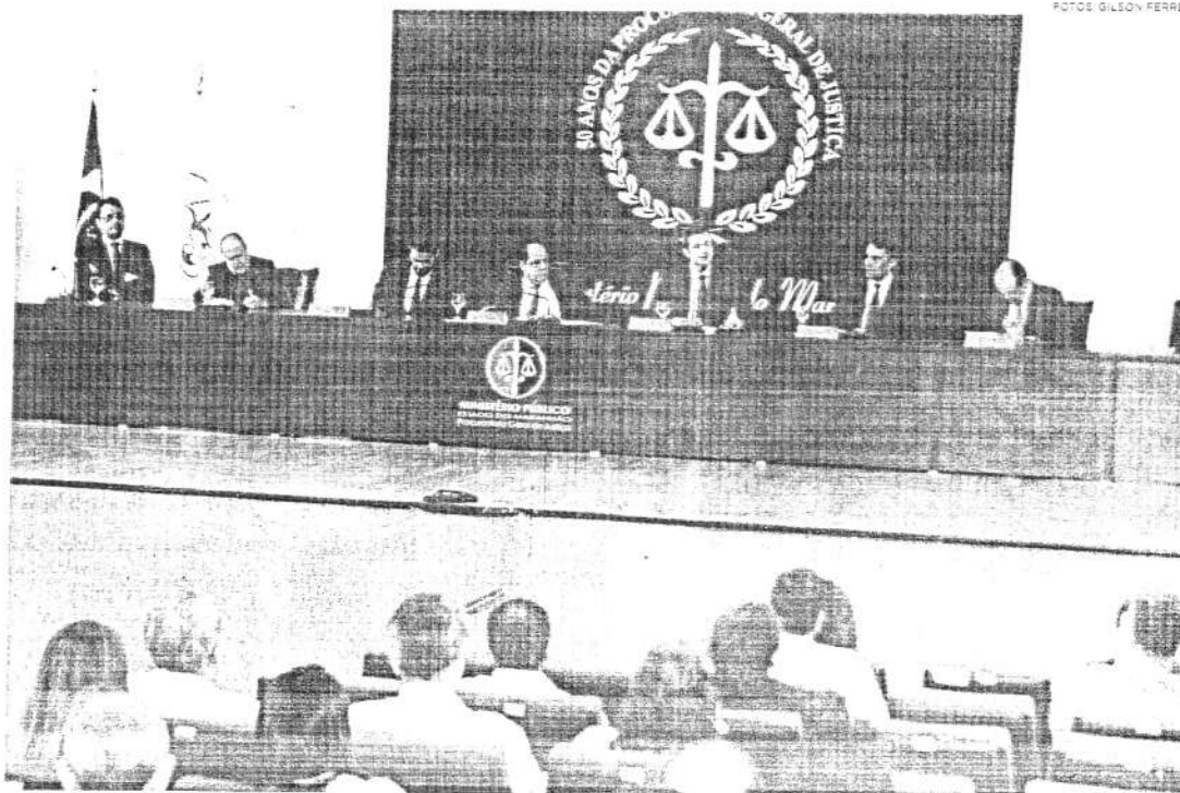
Evento reuniu entidades ligadas aos três poderes para discutir formas de combater a corrupção e a lavagem de dinheiro

A Enccla foi criada em 2003, conforme Ungaretti de Godoy, e ao longo dos últimos 15 anos tem mudado o panorama político e legislativo, tanto no campo legal, quanto no administrativo. "A Estratégia Nacional de Combate à Corrupção e à Lavagem de Dinheiro já produziu efeitos concretos, como a criação da nova lei de Combate ao Crime