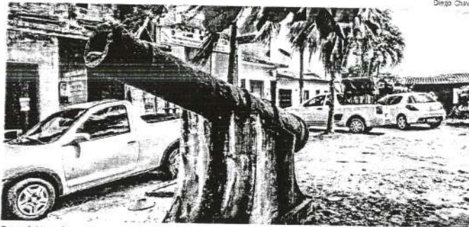
Praça foi transformada em estacionamento; não há cuidados, e moradores reclamam do descaso com o espaço

Fundada no ano de 1979 pelo então governador João Castelo e prefeito Mauro Fecury, o que resta hoje na Praça do Canhão são os canhões enferrujados, piso e bancos deteriorados, ocupação irregular de veículos, teto da tenda re-