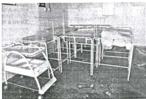
Por falta de uso, equipamentos da unidade de saúde estão cobertos por poeira

No quesito estrutura, em agosto de 2017, na sala de pré-parto só tinha uma cama, cujo colchão estava rasgado. Nesse cômodo, o ar condicionado não funcionava, as lâmpadas queimaram; e, por