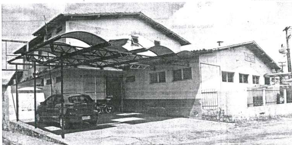
Maternidade Nazira Assub, localizada na Estiva, está fechada faz um ano e aguarda por reforma anunciada desde 2017

No dia 1º de agosto de 2017, a reportagem do Jornal Pequeno visitou a maternidade, quando a unidade de saúde ainda