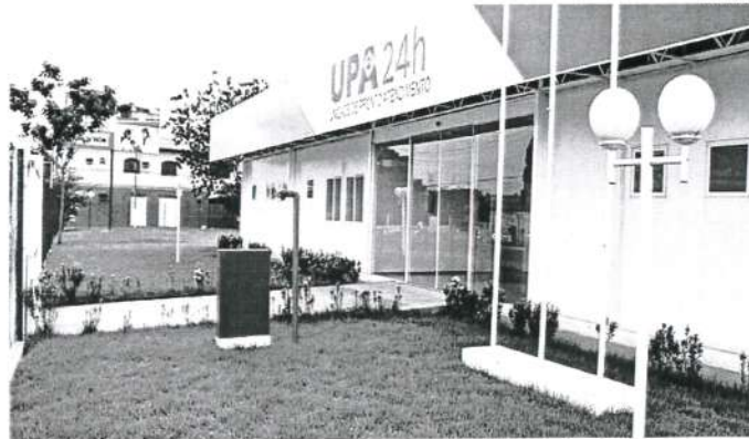
A UPA de Imperatriz, para atendimento de urgência e emergência, foi inaugurada pelo governo passado

Os 20 leitos de UTI eram custeados desde o governo passado de Roseana Sarney. Foram fecha-