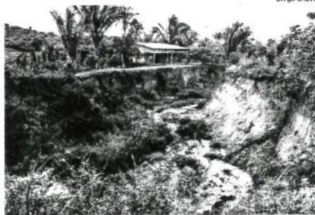
Casa construída à beira de encosta, na área da Ribeira, na zona rural

dutores que ousam percorrer por lá. As vias necessitam de uma obra de pavimentação asfáltica, para que o fluxo de pedestres e veículos seja realizado sem nenhum transtorno. De acordo com moradores, os ônibus não estão mais trafegando pelas vias da habitação, por causa dessa problemática. "Não conhecemos quem está construindo essas casas nesses locais arriscados. Esses estabelecimentos podem desabar. O nosso residencial precisa de uma obra, porque está a cada dia mais destruído. Os coletivos já não entram mais. Só chegamos até a parte da frente, para não quebrar