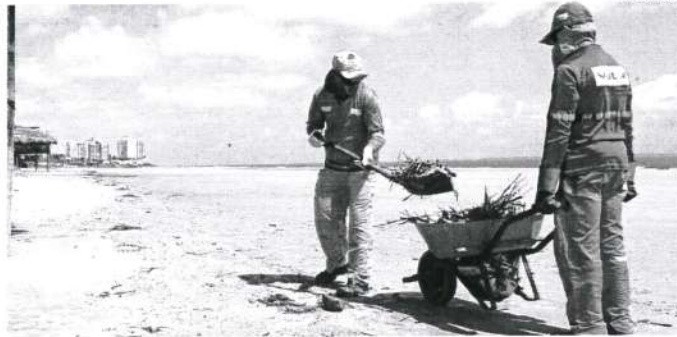
Funcionários da Limpeza Urbana fazem o recolhimento de lixo na orla de São Luís; sujeira é constante

Sobre a praia ser um ótimo lugar para a diversão, não há quem discorde. Mas uma outra realidade que deve ser acordada na orla de São Luís é que, como se não bastasse a condição imprópria para banho em alguns pontos, outra problemática ainda enfrentada é o descarte incorreto do lixo naquele espaço, o que contribui, diretamente, para um cenário negativo e de saúde pública, uma vez que os dejetos podem se juntar ao mar, o que já é um problema grave enfrentado pelos órgãos de defesa e proteção do meio ambiente em todo o país.