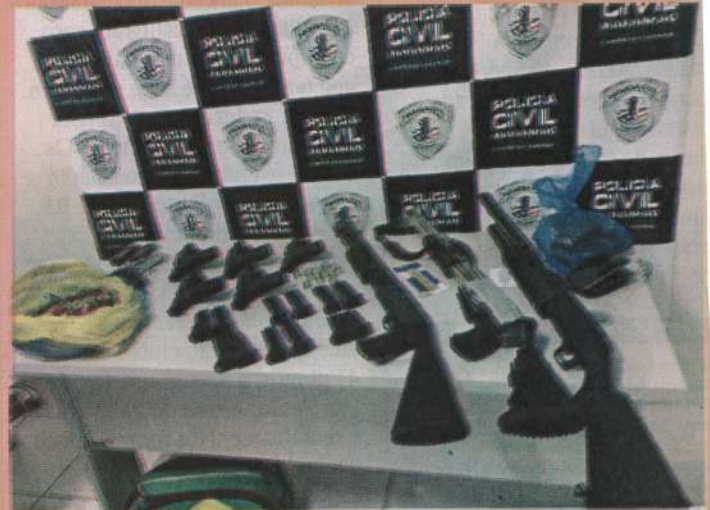
Arsenal apreendido com grupo de ciganos e policial militar, na Chácara Brasil

não “recordava” o nome do militar, sendo que esse teria a função de prestar segurança ao grupo. Os ciganos foram autuados por posse ilegal de arma, e todos os seis presos, incluindo o policial, por formação de quadrilha. Conforme Armando Pacheco, eles permanecem presos no Complexo Penitenciário de Pedrinhas. Foi por meio de denúncias, após ter tido um disparo de arma dentro da casa onde os criminosos moravam, na Chácara Brasil, que a polícia chegou aos ciganos e ao policial.