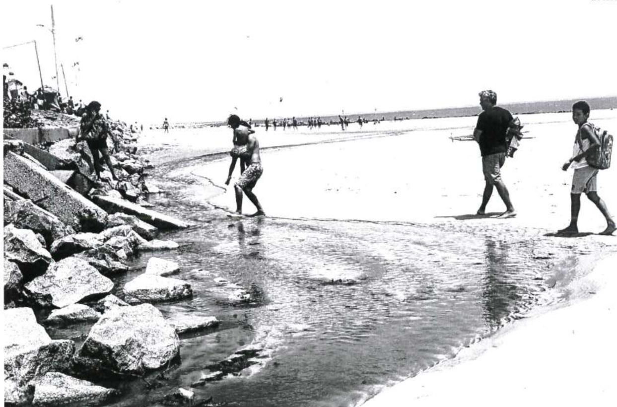
Banhistas, com crianças, tentam ultrapassar área com esgoto in natura , que forma uma língua negra, próximo à avenida Litorânea