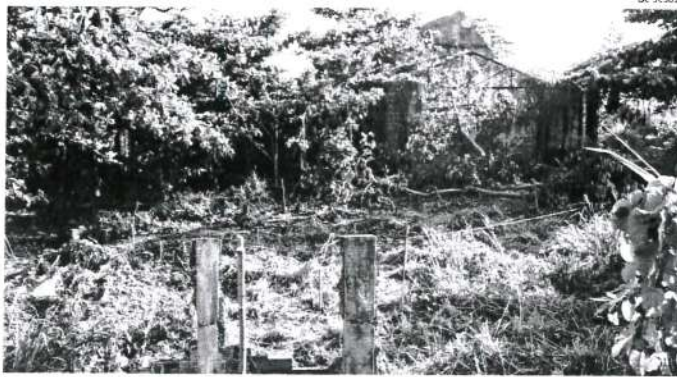
Terreno da antiga fábrica de cimento Nassau, no Monte Castelo, estava sendo demarcado por quadrilheiros

Nas proximidades do prédio da antiga fábrica de cimento Nassau, foi erguido o condomínio do PAC da Fé em Deus. De acordo com os mora-