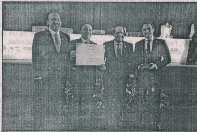
MINISTÉRIO PÚBLICO DO MARANHÃO RECEBEU O PRÊMIO EM BRASÍLIA