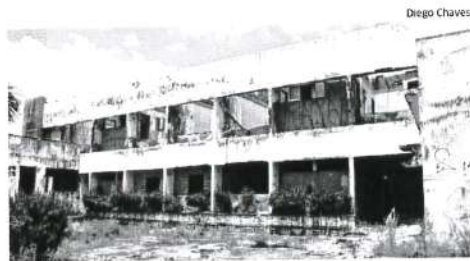
Prédio pode estar sendo usado por criminosos e usuários de drogas

responsável, para saber se órgão tomará alguma providência em relação ao prédio, mas até o fechamento desta edição não houve respostas. ●