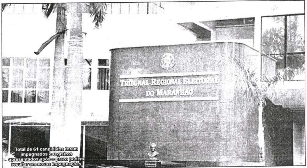
Total de 61 candidatos foram impugnados e registros apresentados após o prazo podem resultar em novas impugnações.

Até a data do julgamento dos registros, qualquer cidadão pode apresentar notificação de inelegibilidade ao Tribunal Regional Eleitoral (TRE-MA) e à Procuradoria Regional Eleitoral (PR-MA).