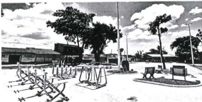
Praças reformadas receberam equipamentos para práticas de atividades físicas, além de playground

E spaços de lazer e convivência social mais adequados, áreas ajardinadas mais agradáveis, playground para a criançada, iluminação diferenciada e espaços para a prática de esportes e atividades físicas ao ar livre compõem a estrutura das novas praças revitalizadas ou construídas pela Prefeitura de São Luís nos últimos anos. Às vésperas de completar 406 anos de fundação, a capital maranhense é presentada com dezenas desses novos logradouros frequentados por crianças, jovens e idosos, em diversos bairros da cidade. Antes considerada um gargalo no setor da infraestrutura de lazer e entretenimento da população, a reforma das praças tornou-se uma prioridade do Município, contabilizando atualmente cerca de 40 espaços amplamente requalificados e entregues à comunidade.