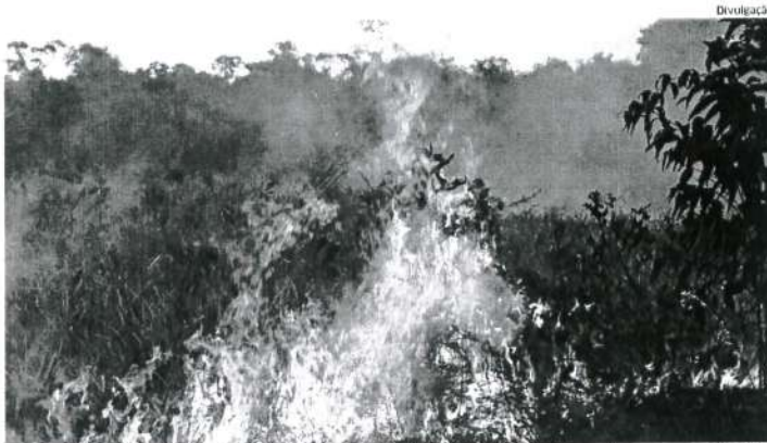
Queimadas se intensificam com a estiagem e ameaçam matas do Nordeste: São Luís segue a tendência

De acordo com o instituto, os municípios de Mirador e Balsas estão incluídos entre os 10 do Brasil com o maior número de queimadas. Em Mirador, onde existe um parque estadual com mais de 437 mil hectares,