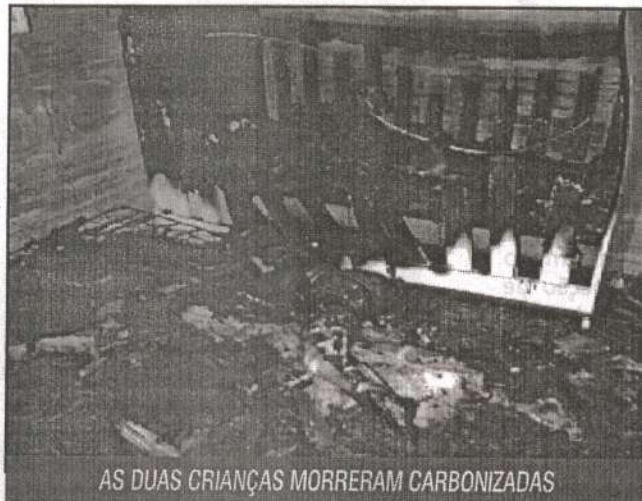
AS DUAS CRIANÇAS MORRERAM CARBONIZADAS

Os pais, que tinha saído para uma festa, foram