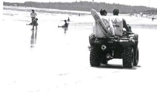
Guardas-vidas durante fiscalização na Praia do Araçagi, ontem de manhã

O Estado foi a praia do Araçagi ontem e constatou a intensa movimentação, além de, também, perceber que os pais estão mais atentos quanto o banho de mar dos seus filhos, como contou o