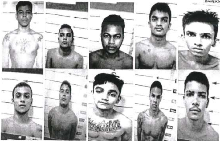
Dez dos 18 detentos que continuam foragidos do presídio de Araguaína onde o maranhense foi morto

Fuga de unidade prisional em Araguaína, na terça-feira, resultou na morte de 10 detentos, 18 estão foragidos e dois reféns ainda estão desaparecidos