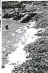
Polição na Lagoa da Jansen afeta o meio ambiente e a saúde