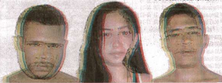
"Seu Edu", Rayanne Danielle e "Morango" foram capturados durante ação do GSA na Jordoa