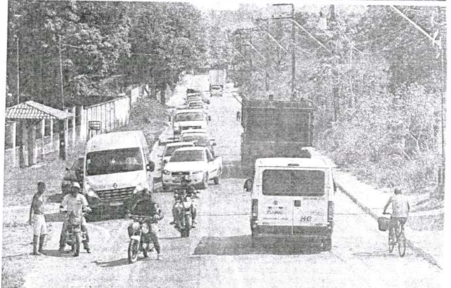
Em protesto por melhorias, moradores da Vila do Povo bloquearam trecho da MA-202, impedindo o tráfego de veículos pela via

José de Ribamar, até 2020. A BRK informou que a Vila do Povo pertence ao sistema de abastecimento 6, previsto no cronograma de investimentos. A