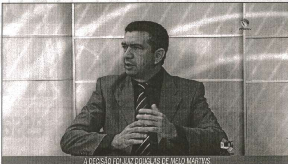
A DECISÃO FOI JUIZ DOUGLAS DE MELO MARTINS

Cabe ao município ainda apresentar o plano que contemple um sistema de drenagem de águas pluviais, além da construção de obras de contenção na área para evitar erosão e assoreamento no Igarapé. Caso o cronograma não seja apresentado em 90 dias, a multa diária é de R$