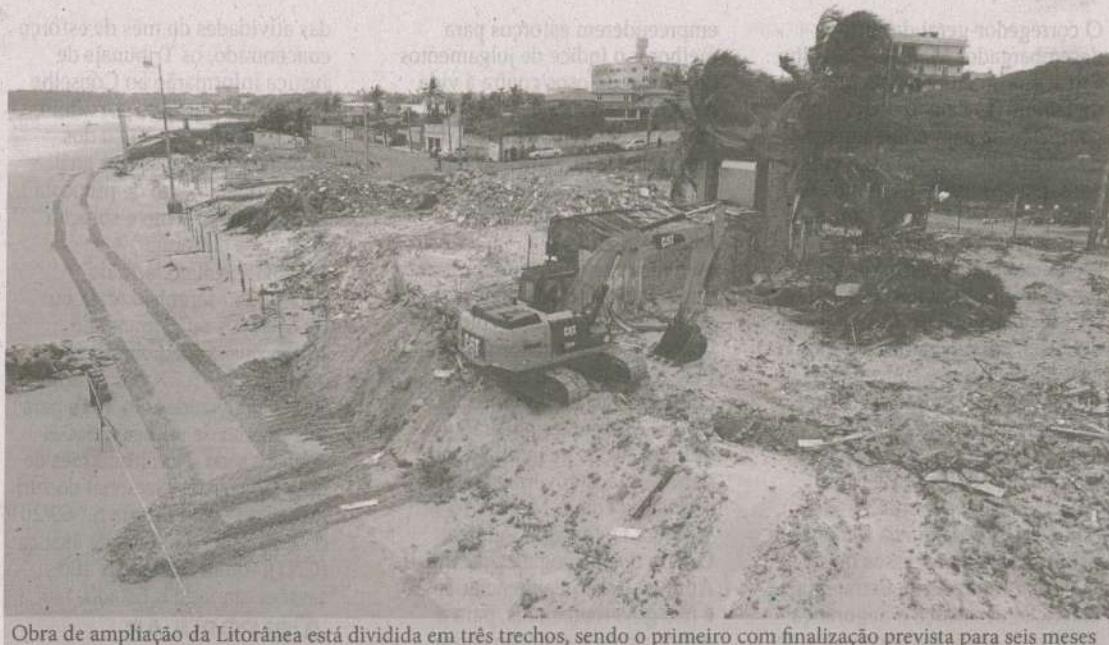
Obra de ampliação da Litorânea está dividida em três trechos, sendo o primeiro com finalização prevista para seis meses