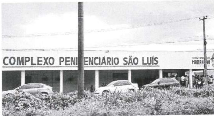
Fachada do Complexo Penitenciário de Pedrinhas, para onde presos deveriam ter retornado ontem