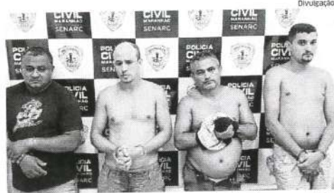
Integrantes de bando preso com entorpecentes durante cerco policial