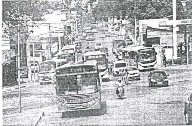
Ônibus ainda paralisaram em algumas empresas, nas primeiras horas da manhã dessa sexta-feira, mas após as 7h circularam normalmente durante todo o dia

As suspensões das atividades dos rodoviários foram decididas durante assembleia geral.