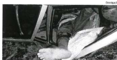
Acidente em Governador Edison Lobão deixou uma pessoa morta