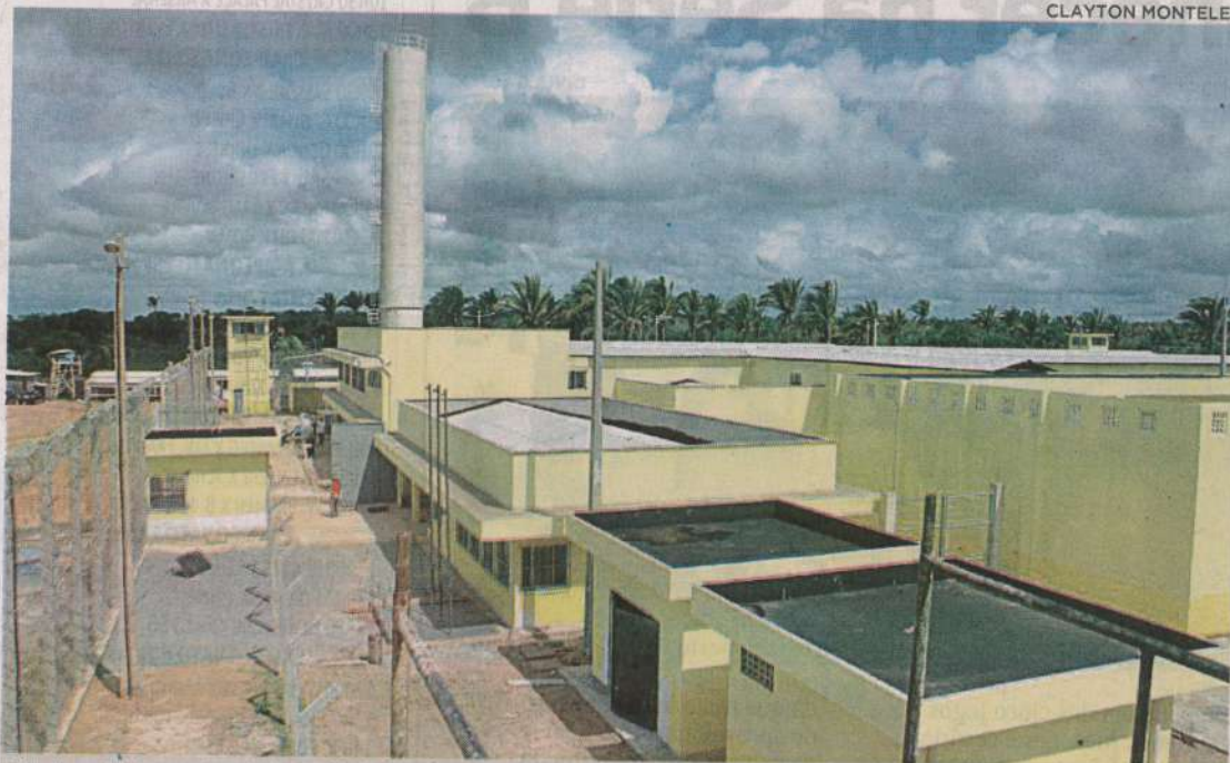
Penitenciária regional de Pinheiro, um das novas unidades entregues pelo governo

O governo do Maranhão, por meio da Secretaria de Estado de Administração Penitenciária (Seap), abriu, entre janeiro de 2015 a setembro de 2018, um total de 3.703 novas vagas no sistema prisional. A meta, que era de abrir 1.840 vagas, em quatro anos, foi superada em 101,2%. Para se ter ideia desse avanço, no final de 2014 haviam 4.589 vagas. Em 2018, esse número já chega a 8.292. Esse acréscimo é resultado, também, da entrega de três novas unidades prisionais, sendo elas: as Penitenciárias Regionais de Pinheiro, Imperatriz e de Timon, totalizando 832 novas vagas prisionais.