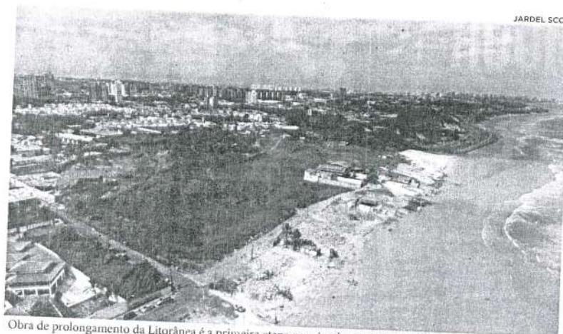
Obra de prolongamento da Litorânea é a primeira etapa para implantação do BRT