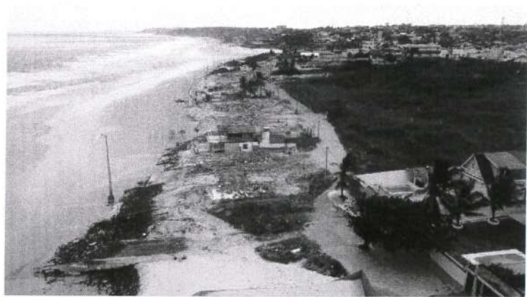
AVENIDA LITORÂNEA CONTARÁ COM UMA VIA EXCLUSIVA PARA A INSTALAÇÃO DO BRT