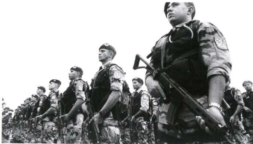
COM AUTORIZAÇÃO, AS TROPAS FEDERAIS PARTIRAM PARA BACABAL NESTE SÁBADO

firmou o envio das tropas que se deslocaram para a cidade de Bacabal, ontem, ao meio-dia.