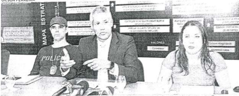
Representantes da Polícia, do Ministério Público e da CGU fornecem detalhes da Operação Cooperare

Desde 2015, são investigadas irregularidades na contratação da Coopmar por 17 prefeituras, que resultaram no desvio de mais de R$ 200 milhões