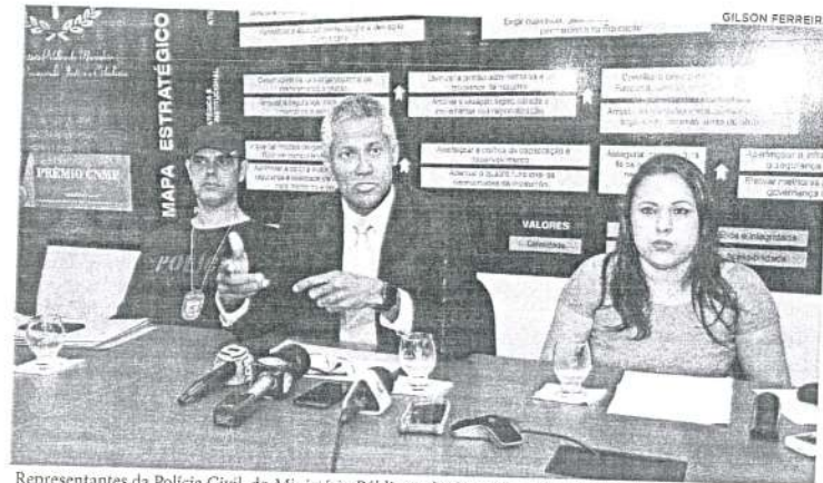
Representantes da Polícia Civil, do Ministério Público e da CGU fornecem detalhes da Operação Cooperare, que cumpriu 11 mandados de prisão na capital e em Paço do Lumiar