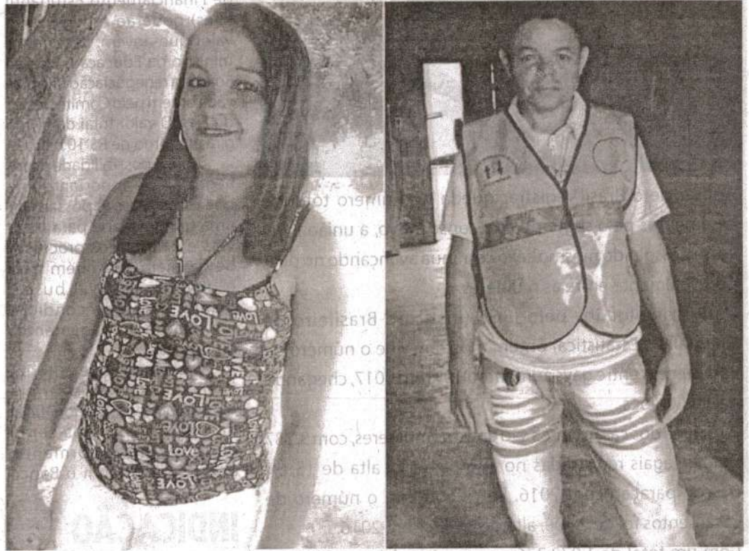
O crime ocorreu por volta de 22h30 de terça-feira (30) na Rua 11 de outubro, no bairro Novo Bacabal