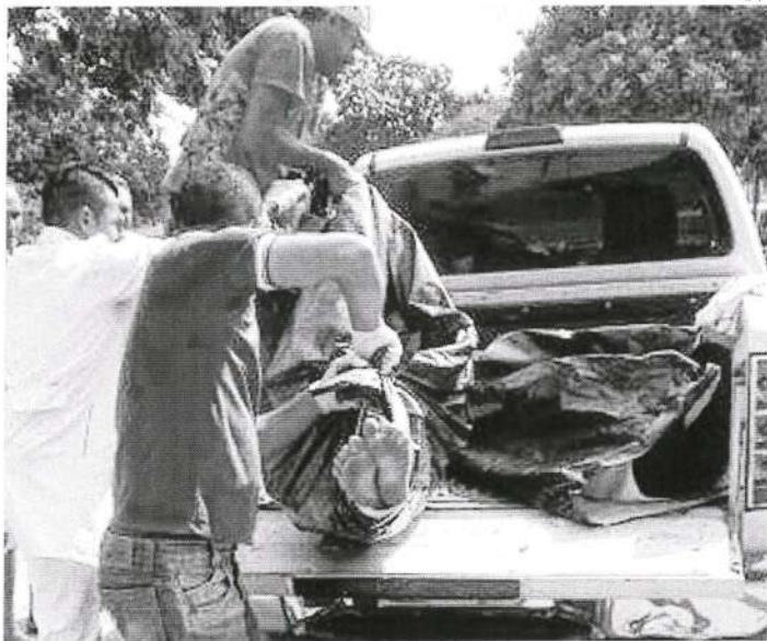
Corpo de vítima de feminicídio ocorrido ontem no povoado São Patrício, zona rural de Cantanhede

A polícia também registrou crime de feminicídio na cidade de Bacabal durante a noite da última terça-feira. Se-