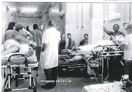
Imagens de Colômbia

Em agosto, corredores do Socorrão II estavam lotados de pacientes