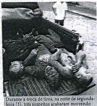
Durante a troca de tiros, na noite de segunda-feira (3), três suspeitos acabaram morrendo