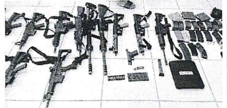
Armas de grosso calibre apreendidas com os bandidos presos ontem