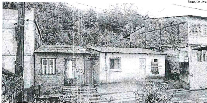
Casas construídas sob encostas correm riscos durante o período chuvoso, pelo perigo de deslizamento de terra

Em relatório divulgado pela Secretaria Municipal de Segurança com Cidadania (Semusc), em janeiro deste ano, 60 áreas de São Luís têm corrente risco de alagamentos, desmoronamento, alívio, entre outros. O levantamento para o ano de 2018 deve ser entregue apenas no fim de dezembro, quando os