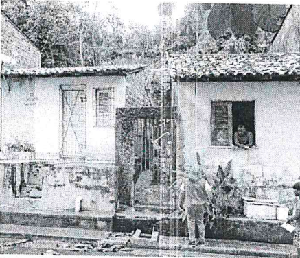
Equipe da Defesa Civil percorreu a Rua Thomaz de Aquino, no Sá Viana

dados do Centro Nacional de Monitoramento e Alertas de Desastres Naturais (Cemaden) serão reavaliados pela Semusc e Defesa Civil. A expectativa é de que após os casos