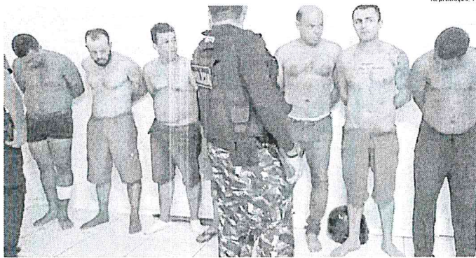
Assaltantes presos pela polícia quando eram apresentados na delegacia de Polícia Civil, na cidade de Zé Doca

Durante a operação, os policiais militares apreenderam armas e munições, além de malotes com cédulas, que podem pertencer ao Banco do Brasil de Bacabal. Ao todo, foram recolhidos 11 fuzis, duas metralhadoras ponto 50 (artilharia anti-aérea), duas pistolas e coleres. A quantia de dinheiro encontrada com os bandidos não foi revelada pela polícia. Os policiais acreditam