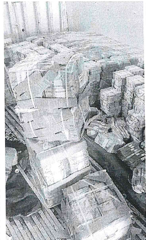
Parte do dinheiro roubado do BB que estava com os assaltantes