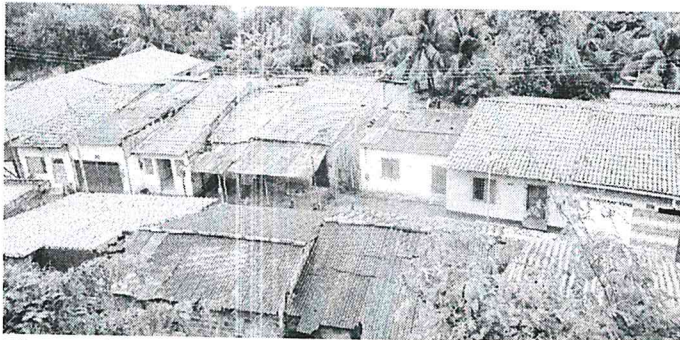
Muitas casas no Sá Viana estão em trechos de encosta e fazem parte das áreas de risco verificadas pela Defesa Civil