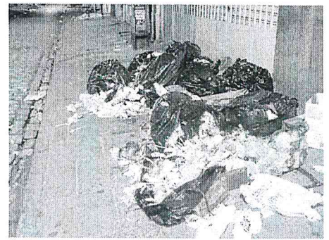
Plástico e papelão, ao serem descartados, se espalham pela Rua Grande

fim de ano, o movimento de consumidores na Rua Grande torna-se mais intenso. Nesta perspectiva, é comum observar que o descarte incorreto de resíduos também passa a ser mais frequente. Assim como a produção, por parte dos comerciantes e lojistas da localidade tendem a produzir mais lixo, em decorrência da reposição do estoque.