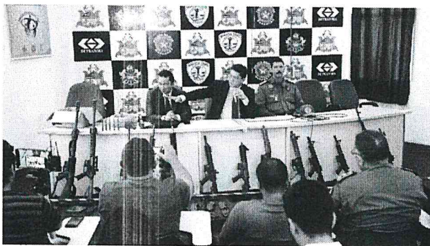
O SECRETÁRIO AFIRMOU QUE O "NOVO CANGAÇO" NÃO TERÁ ESPAÇO NO MARANHÃO

O secretário afirmou que o "novo cangaço" não terá espaço no Maranhão. "O tempo de Lampião acabou faz tempo, aqui vale a força da lei. Temos poder de fogo igual ou maior aos assaltantes. E volto a dizer, tanto a bravura dos nossos policiais, e a capacidade do governo do estado em apli-