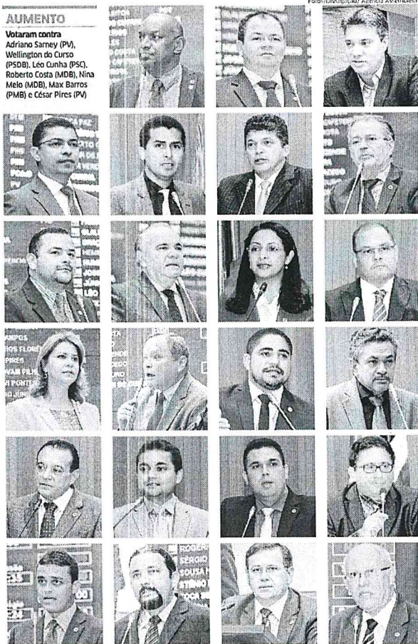
Deputados governistas não defenderam a proposta, mas votaram sem fazer qualquer tipo de contestação