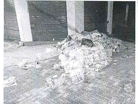
Presidente do Impur fez registro e criticou estado da via, em reforma