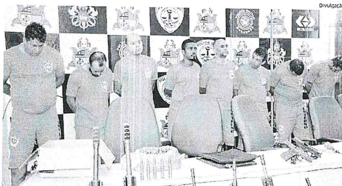
Oito dos 10 assaltantes que infernizaram a cidade de Bacabal foram apresentados ontem, na sede da SSP

"Há uma falha por parte dos bancos, que não garantem a segurança dos profissionais que ali estão e dos clientes, mas também o Governo do Estado não investe em serviço de inteligência, em investigações mais preventivas. Uma quadrilha interestadual desse porte não chegou à cidade do nada, teve um planejamento. Há uma facilidade para os criminosos, porque o Estado é pouco vigiado. Acredito que há um baixo número de policiais civis e militares disponíveis, para manter a segurança e vigiar as cidades maranhenses. Além disso, deve haver mais policiamento, também, nas fronteiras", sugeriu Nascimento.