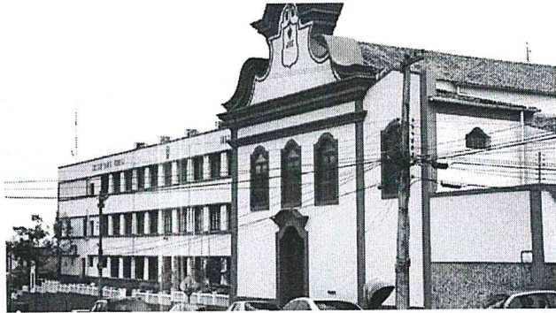
HISTÓRIA DO COLÉGIO SANTA TERESA SERÁ A PRIMEIRA A SER CONTADA PELA SÉRIE

Considerando as ações de cidades que têm acervo patrimonial muito grande como São Luís, que está recebendo diversas obras para a sua conservação e reabilitação de monumentos históricos, o Jornal O Imparcial lança, hoje, a série de reportagens, intitulada Caminhos da Memória , que tem como objetivo principal sensibilizar a população sobre a importância de preservar o patrimônio histórico da Ilha. De acordo com o coordenador de redação de O Imparcial , Celio Sergio, a ideia de lançar uma série que valoriza o patrimônio histórico, em uma data especial como a de hoje, tem um valor muito significativo. "Ao longo de seus 92 anos, foi testemunha das transformações sociais e políticas que ocorreram São Luís, retratando, por meio de suas notícias, o crescimento da cidade e a formação de sua população. Acreditamos que é impor-