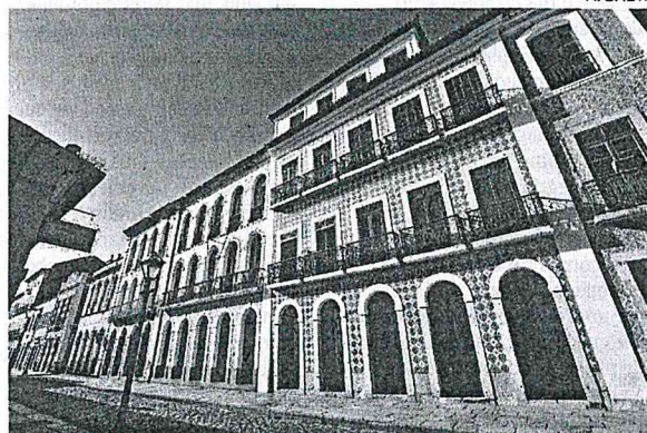
Casarões históricos e a grande variedade de azulejos estão entre os fatores que garantiram a São Luís o título de Patrimônio da Humanidade