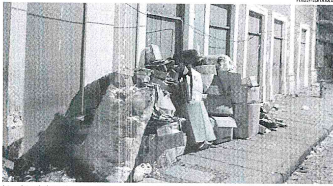
Material reciclável e lixo são descartados diante de lojas na Rua Grande durante a noite; situação foi denunciada