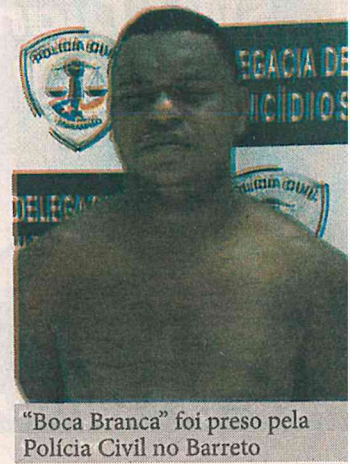
"Boca Branca" foi preso pela Polícia Civil no Barreto