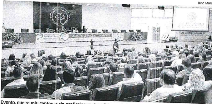
Evento, que reuniu centenas de profissionais de saúde e estudantes da área, discutiu vários assuntos

Evento promoveu debate e traçou estratégias para reduzir a mortalidade materna, infantil e fetal, além da eliminação da sífilis