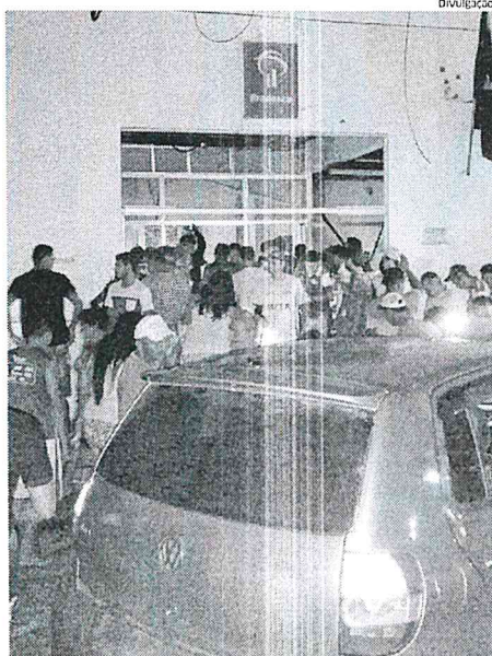
População observa estrago causado pela explosão na agência do Bradesco

Com mais esse caso em Arame, o Maranhão registra, neste ano, 23 ações criminosas contra agências bancárias, conforme dados do Sindicato dos Bancários. Do número total de investidas, foram 14 arrombamentos, três assaltos, quatro tentati-