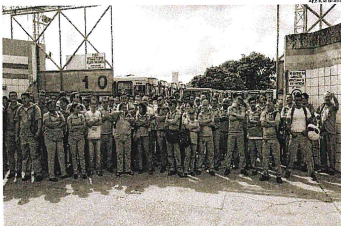
Os motoristas da empresa 1001 decidiram parar na sexta-feira (28) em protesto pelo atraso de salários

Mais de 500 motoristas e cobradores passaram toda a tarde de sexta, nos arredores da empresa, esperando por alguma decisão. Em