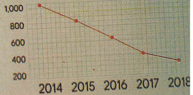
ACUMULADO TOTAL DE VÍTIMAS DE HOMICÍDIOS DE 2014 A 2018

integrar a frota policial. Nos presídios, novas 3.700 vagas foram abertas para su o incremento de prisões com aumento do combate ao crim