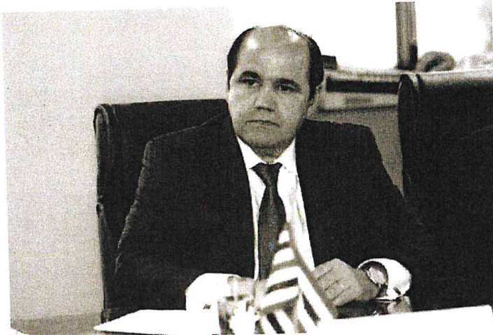
"SOZINHOS VAMOS MAIS RÁPIDO, JUNTOS VAMOS MAIS LONGE", DIZ O PROCURADOR-GERAL

Do ponto de vista estrutural, cumprimos a meta estabelecida para o ano de 2018 e estamos melhorando de forma relevante as instalações físicas das Promotorias por todo o Estado. Conseguimos entregar duas grandiosas obras, que tem grande impacto social: as Promotorias de Justiça da Capital, em março, e agora em dezembro a antiga sede da PGJ, no Centro, que abriga o Centro Cultural e Administrativo do MPMA. Além disso, entregamos várias novas sedes de promotorias, como as de Matões, Bequimão, Urbano Santos e Barão de Grajaú. Mais de 60 Promotorias de Justiça receberam pequenas ou grandes reformas. Iniciamos e demos continuidade à construção de mais de uma dezena de novas sedes de promotorias por todo Estado, a maior parte das quais encontra-se em fase de entrega, como as de Santa Helena, Rosário, Codó, Caxias, Timon, Coelho Neto, Tutóia, São Bernardo, João Lisboa e Açailândia. Finalizamos as licitações de Barra do Corda, Gov. Nunes Freire e S. José de Ribamar, cujas obras serão iniciadas em 2019. Logramos também implantar na se-