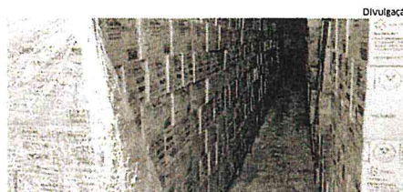
Caixas de café moído a vácuo apreendidas em armazém, em Codó

Policial militar baleado no São Cristóvão oestadoma.com/456596