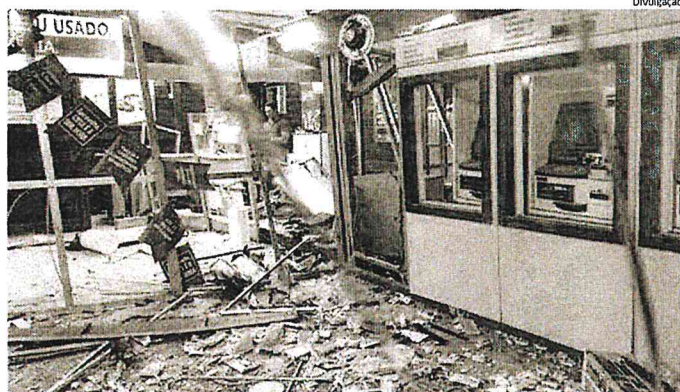
Agência do Banco do Brasil na cidade de Bacabal ficou destruída; ataque ocorreu no dia 25 de novembro

Dois casos não constam nos registros do sindicato, como um assalto a uma agência da Caixa Econômica Federal (CEF), na Rua Bonaire, em Açailândia, este mês. Suspeito de envolvimento nessa ação crimi-