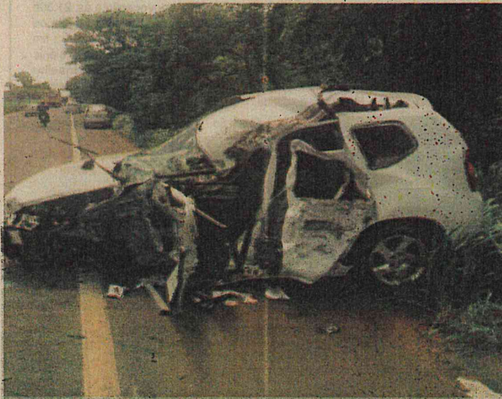
Duster envolvido em acidente na BR-010 ficou parcialmente destruída