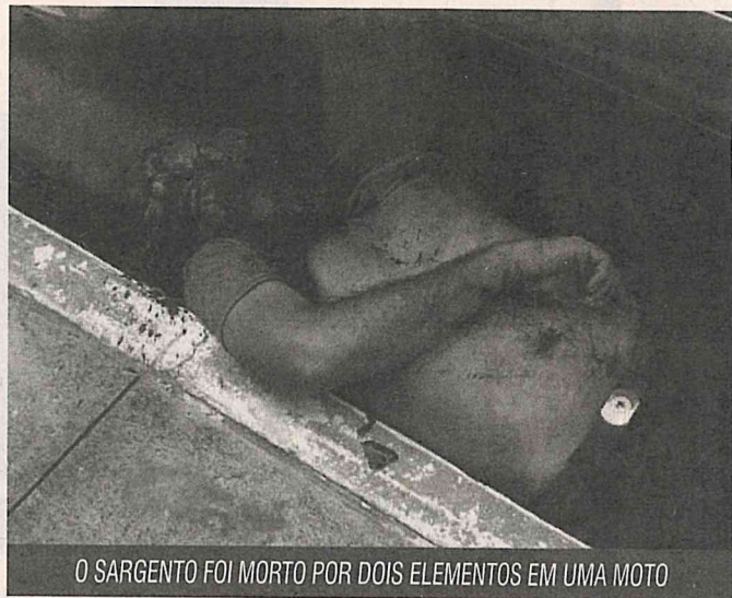
O SARGENTO FOI MORTO POR DOIS ELEMENTOS EM UMA MOTO

Segundo informações da PM, o sargento foi vítima de latrocínio, uma vez que ele teria ido ao banco sacar uma quantia para a empresa que ele prestava serviços quando foi surpreendido por dois elementos em uma motocicleta modelo Honda Titan que deram voz de assalto e o sargento teria reagido travando uma luta corporal com os elementos e acabou sendo alvejado e morto a tiros.