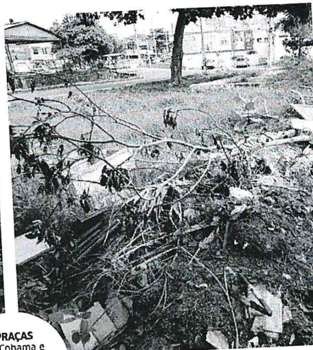
PRAÇAS na Cohama e Planalto Vinhais II estão com mato alto e falta de manutenção