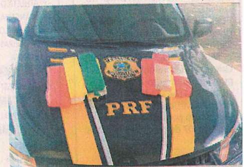
A maconha apreendida foi localizada no compartimento de bagagens do ônibus

em uma mala preta pertencente à mulher, nove tabletes de aproximadamente 10 kg de maconha. A acusada, que não teve o nome divulgado, confirmou que comprou a droga em Goiânia no valor de R$ 4 mil, e que se deslocava para Belém com o intuito de vender os tabletes. A mulher foi encaminhada para a Polícia Civil da cidade de Estreito. De acordo com informações da PRF, não foi necessária a utilização de algemas.