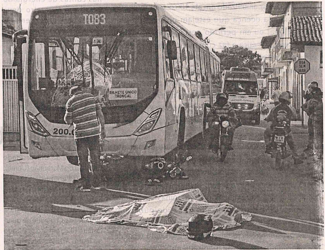
A moto andava em alta velocidade e foram de encontro ao ônibus

Duas pessoas estavam na garupa na garupa da moto, uma mulher e uma travesti, que ainda não foram identificadas. Eles sacaram para longe no momento da colisão, mas