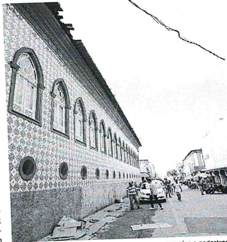
Telhas do Palacete Gentil Braga caem na rua e geram perigo a pedestres

A assessoria de comunicação da Universidade Federal do Maranhão (UFMA), que responde pelo prédio, pediu que uma equipe da empresa terceirizada que realiza as obras no local