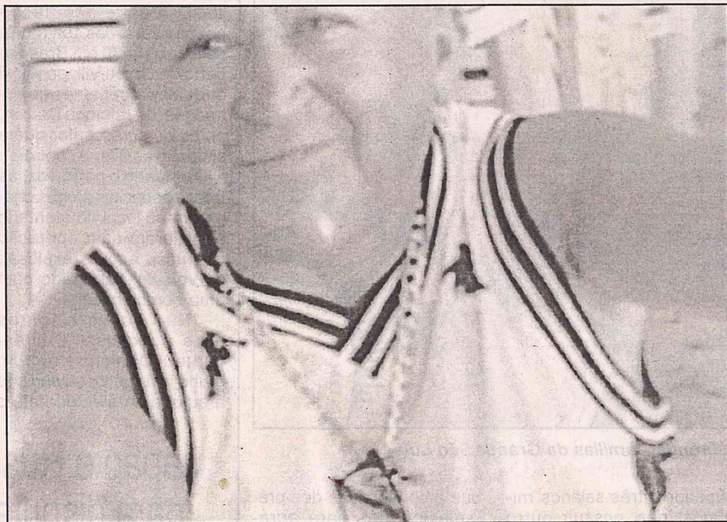
"Bebê" reagiu ao assalto e acabou levando três tiros fatais

Os autores do homicídio fugiram logo após o crime e ainda não foram identificados pela polícia.