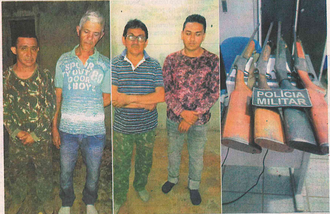
Os suspeitos presos em Pastos Bons e as armas que estavam em posse deles

De acordo com informações da Polícia Militar, as armas se tratavam de duas espingardas de modelo CBC, calibre 32 e 36; e duas modelo Boito calibres 36. Além do armamento, três facões e uma faca também foram apreendidos. (LM)