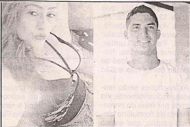
Cellyara desferiu três em Gutemberg

De acordo com a PRF, a motocicleta possui rastreamento eletrônico, o qual foi utilizado pela equipe para encontrá-la dentro da mata no bairro Coqueiro, na saída da capital maranhense.