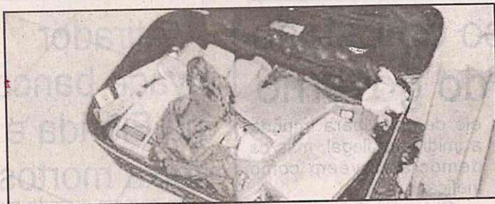
44 kg de maconha, 2 kg de cocaína, 12 balas de .40, três balanças e duas motocicletas roubadas

sibilidade de que os donos da casa de festas soubessem da ação realizada pelo segurança e continuam as