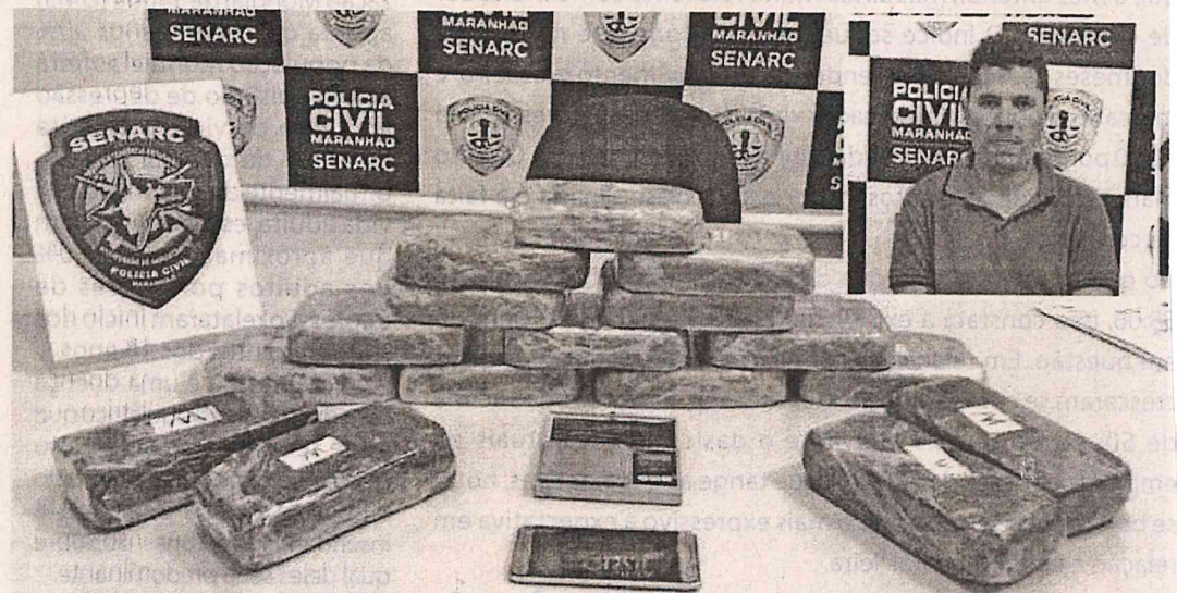
A droga está avaliada em R$ 300 mil

Segundo informações da polícia, uma equipe da Senarc estava realizando operações no interior desde sexta-feira (25), quando receberam denúncia de que um veículo VW Fox, de cor branca, estava transportando grande quantidade de drogas para a região central do Estado. Foram rea-