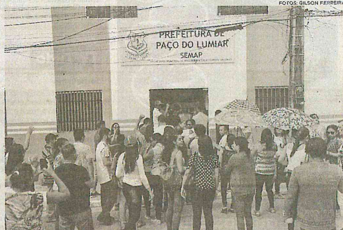
Professores de Paço do Lumiar voltam a cobrar seus direitos, em caminhada pelas ruas do município até a frente da Prefeitura