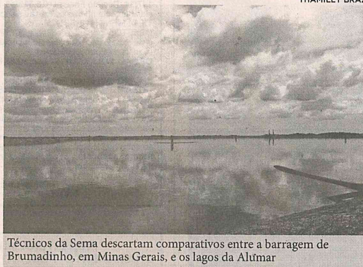
Técnicos da Sema descartam comparativos entre a barragem de Brumadinho, em Minas Gerais, e os lagos da Alumar

Após apresentação, os técnicos realizaram vistoria em todas as barragens em operação. “Foi constatado, em análise preliminar, que o funcionamento encontra-se regular, em conformidade com a Política Nacional de Segurança