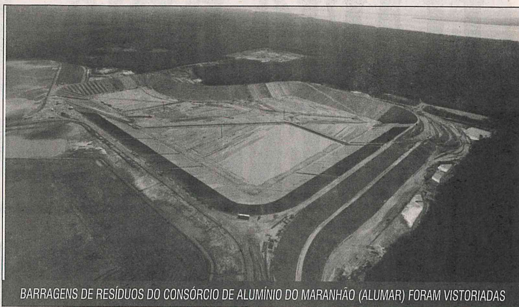
BARRAGENS DE RESÍDUOS DO CONSÓRCIO DE ALUMÍNIO DO MARANHÃO (ALUMAR) FORAM VISTORIADAS

"O monitoramento e a fiscalização de barragens ocorrem de modo efetivo e contínuo. Na ALUMAR, por exemplo, é feito semestralmente, como forma de verificar a estabilidade do barramento. É válido considerar, ainda, que o método construtivo das barragens em operação