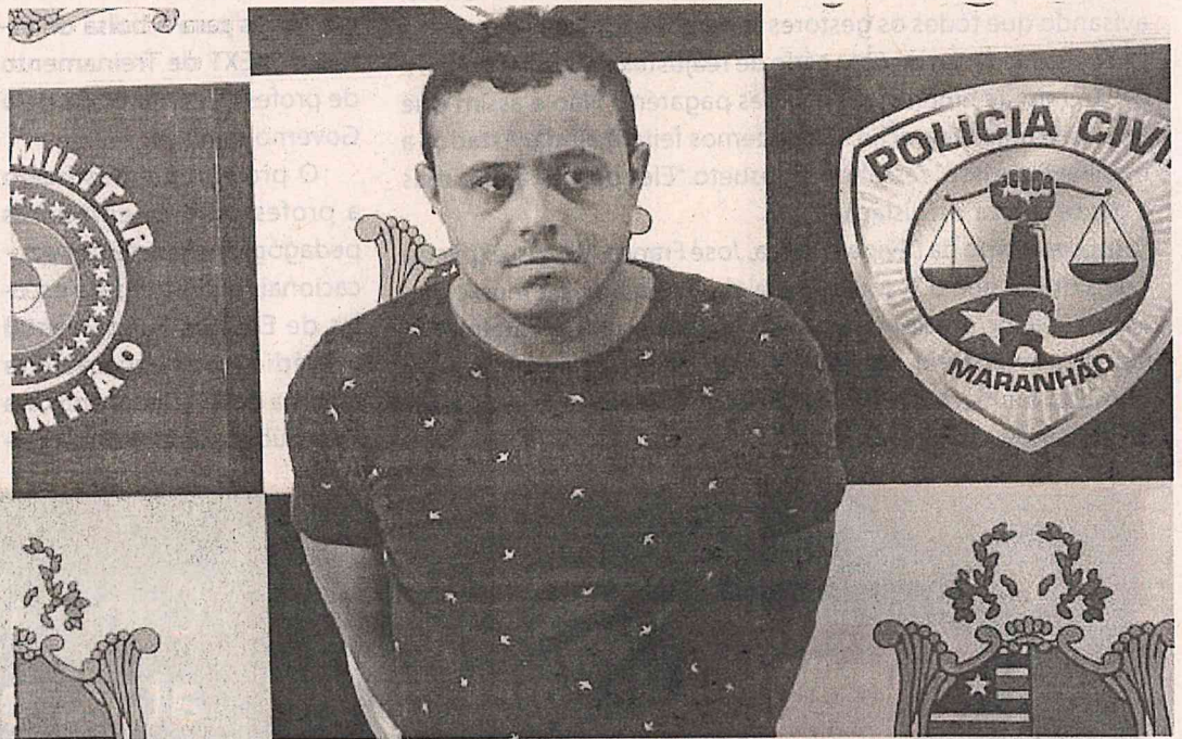
Ele foi preso em flagrante na madrugada do último sábado (26)

A polícia está tentando identificar e localizar o motorista do carro utilizado pelos policiais nessa empreitada criminosa.