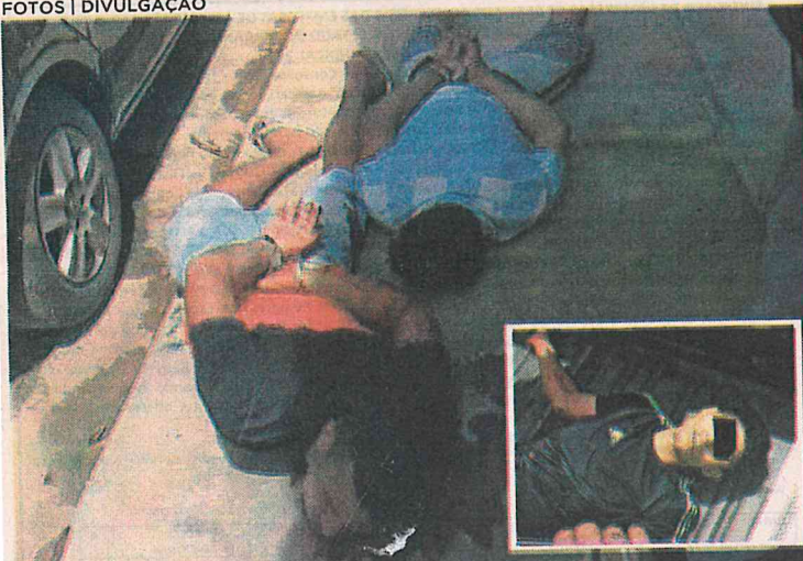
Dois assaltantes foram presos e outro morreu em confronto com a PM, em Pedro do Rosário