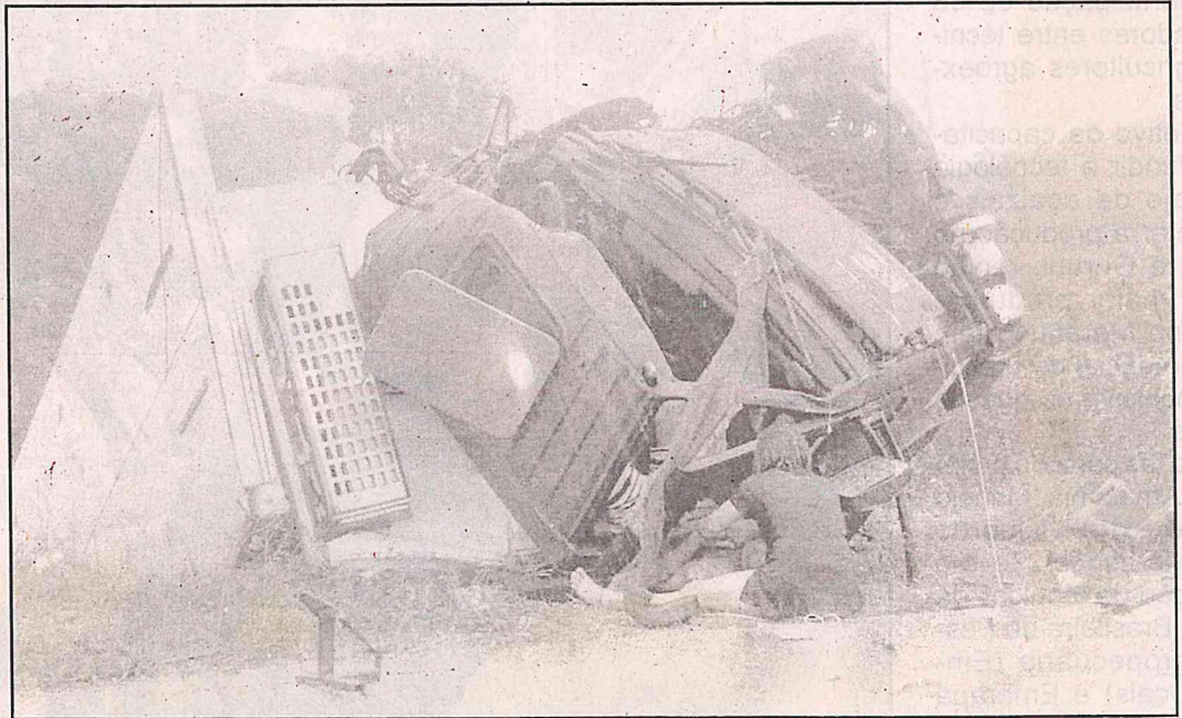
Caminhão ficou completamente destruído após o acidente

Segundo testemunhas, houve uma colisão frontal entre o caminhão e a van que saiu de São Luís com destino a Humberto de Campos. A Polícia Rodoviária Federal informou que o número de mortos e feridos ainda está sendo contabilizado. As causas do acidente também estão sendo investigadas.