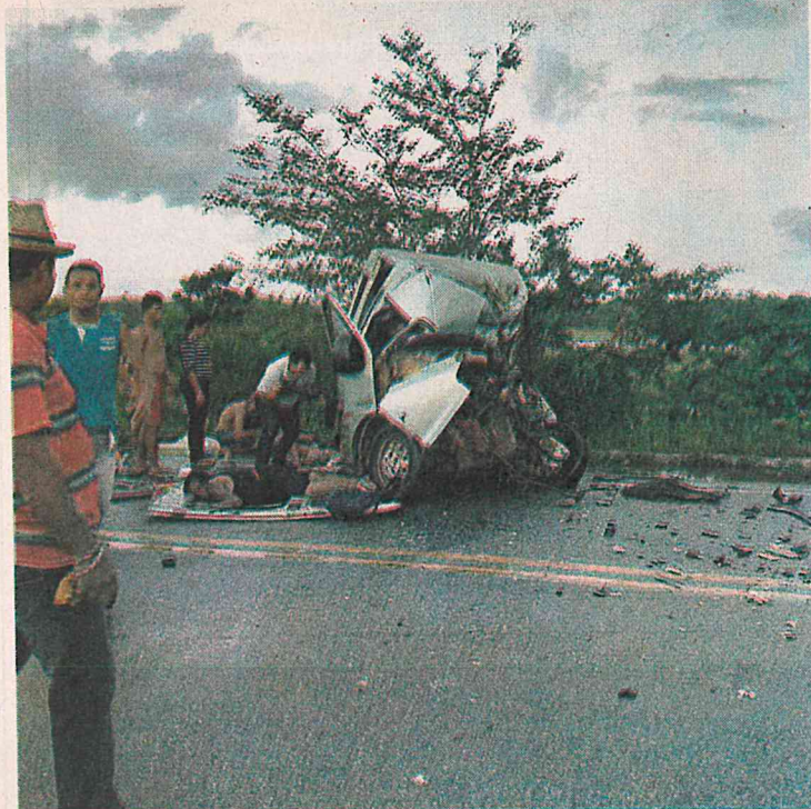
Populares ajudaram a retirar os passageiros de dentro da van, que ficou completamente destruída

A Secretaria de Estado da Saúde (SES) informou que nove vítimas do acidente foram atendidas no Hospital Regional de Morros. E que, na noite de ontem, três delas permaneciam em observação naquela unidade médica, com quadro de saúde estável – dessas duas são crianças. A SES comunicou ainda que as outras seis vítimas foram transferidas para o Hospital Municipal Dr. Clementino Moura, o Socorrão 2, em São Luís.