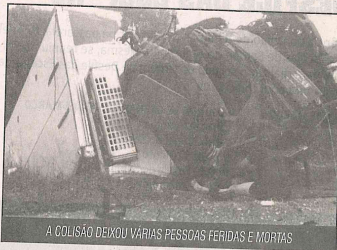
A COLISÃO DEIXOU VÁRIAS PESSOAS FERIDAS E MORTAS

A Polícia Rodoviária Federal (PRF) deve deslocar equipe até o local para fazer os primeiros levantamentos.