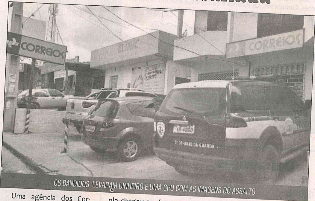
OS BANDIDOS LEVARAM DINHEIRO E UMA CPU COM AS IMAGENS DO ASSALTO

Uma agência dos Correios, localizada no bairro Anjo da Guarda foi assaltada na manhã desta quinta-feira (31) por dois homens que portavam armas de fogo.