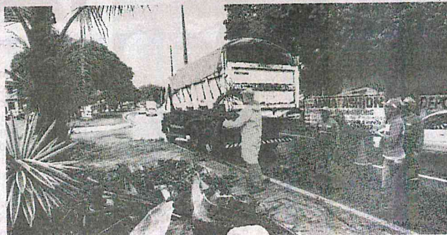
PREFEITURA RECOLHE DIARIAMENTE 1.300 TONELADAS DE LIXO NA CAPITAL