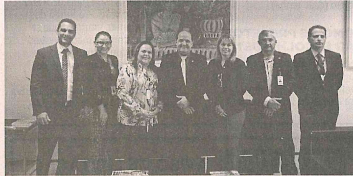
Solenidade de assinatura do termo de cooperação técnica entre o Detran-MA e o MPMA