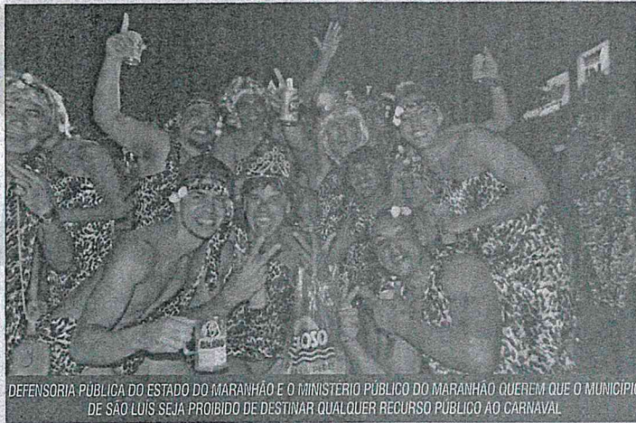
DEFENSORIA PÚBLICA DO ESTADO DO MARANHÃO E O MINISTÉRIO PÚBLICO DO MARANHÃO QUEREM QUE O MUNICÍPIO DE SÃO LUÍS SEJA PROIBIDO DE DESTINAR QUALQUER RECURSO PÚBLICO AO CARNAVAL