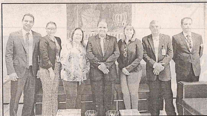
Solenidade de assinatura do termo de cooperação técnica entre o Detran-MA e o MPMA

Os acessos serão disponibilizados aos promotores de justiça, integrantes do Grupo de Atuação Especial de Combate às Organizações Criminosas (Gaeco), e membros da Assessoria Especial