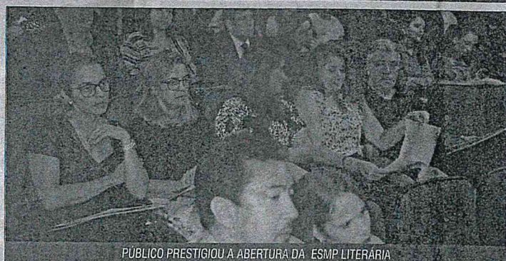
PÚBLICO PRESTIGIOU A ABERTURA DA ESMP LITERÁRIA

sumo, que é tido como felicidade. "É uma nova lógica, do sucesso individual, cujo meio é a competição. Destaca-se a moral do sucesso, do êxito, do sucesso do vencedor. Se você não se adapta, você é considerado um fraco, alguém que sucumbiu", afirmou.