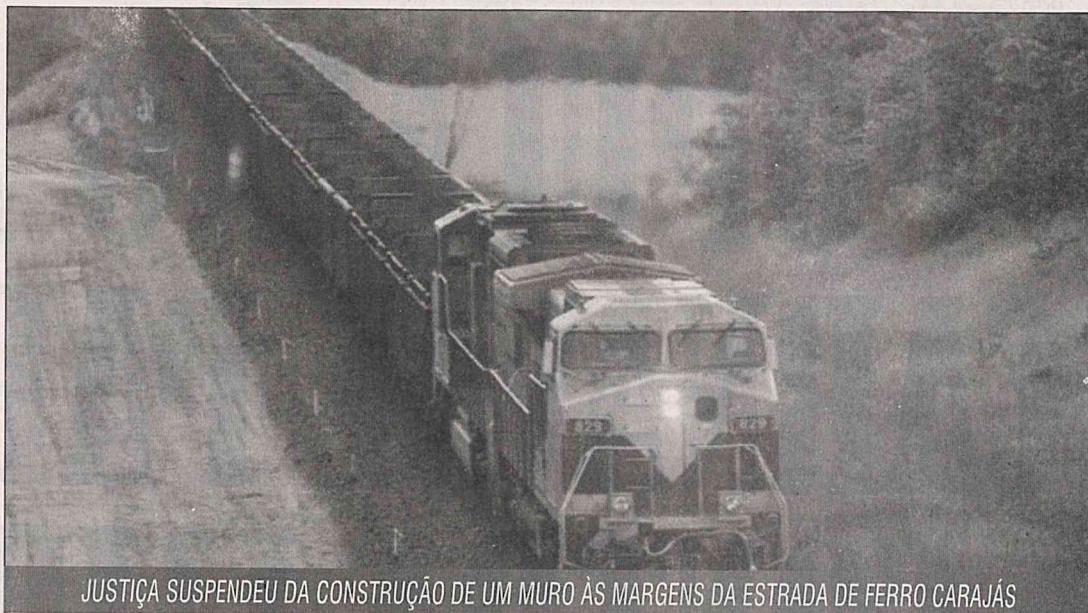
JUSTIÇA SUSPENDEU DA CONSTRUÇÃO DE UM MURO ÀS MARGENS DA ESTRADA DE FERRO CARAJÁS

Questionada pelo MP, a Vale S.A teria fornecido as licenças necessárias para a realização da duplicação da estrada de ferro, mas não relativos à construção do muro entre os quilômetros 158 e 162. Também não teriam fornecido laudos ambientais estaduais e federais, estudos sociais e ambientais a serem realizados