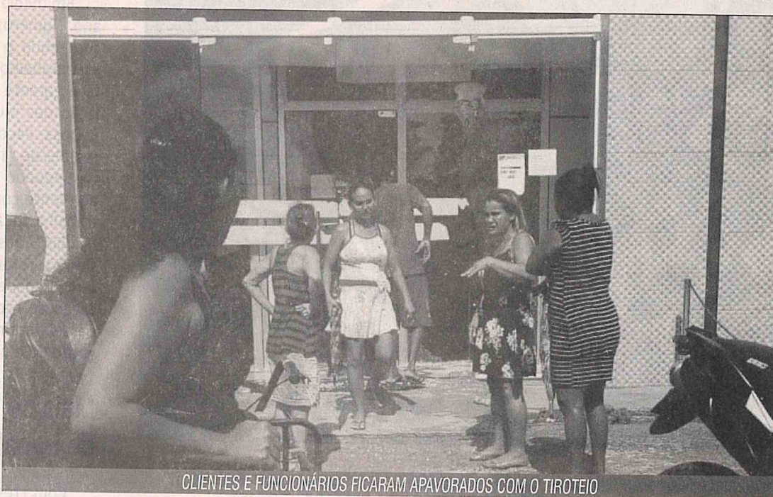
CLIENTES E FUNCIONÁRIOS FICARAM APAVORADOS COM O TIROTEIO

Ainda segundo informações preliminares, seriam três indivíduos num carro GOL prata, de placa com terminação 1750. Os bandidos fugiram na contramão em direção à MA 201 (Estrada de Ribamar). A polícia fazia rondas pelo local e deu início a uma perseguição, não há confirmação de prisões.