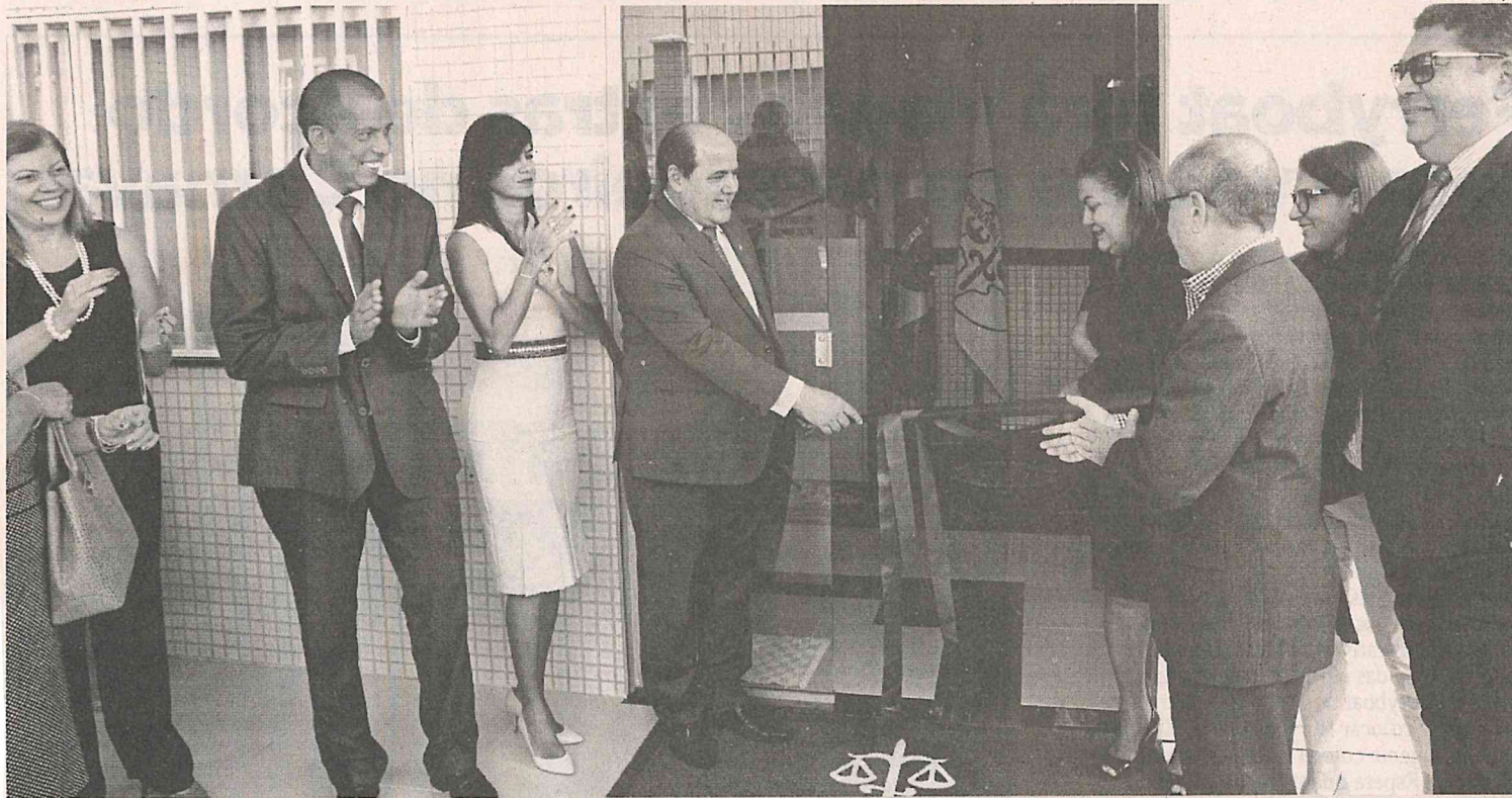
Solenidade de inauguração da sede das Promotorias na cidade de Rosário

Aconteceu na manhã dessa terça-feira, 26, a cerimônia de inauguração da nova Promotoria de Justiça de Rosário. O prédio, localizado na Rua Bom Jesus, tem 295,75 m 2 de área construída, em um terreno de 906,58m 2 , doado pelo Município para a construção da sede do Ministério Público na comarca. O diretor-geral da Procuradoria Geral de Justiça, Emmanuel Guterres Soares, fez uma apresentação com informações