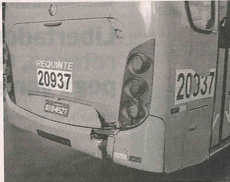
Ônibus que foi apedrejado por bandidos ontem, na Estrada da Mata

No momento do ataque, não havia passageiro no ônibus. De acordo com o condutor, havia acabado de sair da garagem e estava seguindo para a primeira viagem do dia. O coletivo teve dano na traseira e no para-brisa. A polícia foi acionada e realizou rondas na localidade, mas não conseguiu pren-