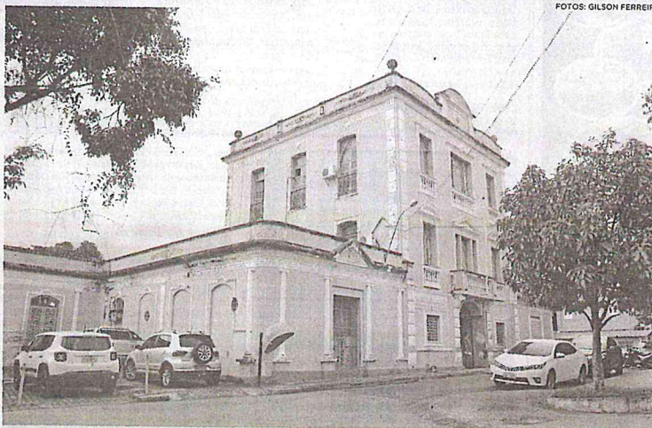
Entidade alerta para a possibilidade de serviços pararem na Superintendência da Agricultura, devido à defasagem de servidores