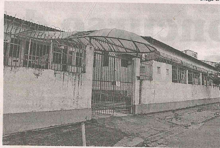
Maternidade Maria do Amparo, no Anil: atendimentos serão retomados

A suspensão do atendimento a gestantes na Maternidade Maria do Amparo ocorreu pelo término do convênio com o Governo do Estado. No fim de 2018, o Governo deixou de dar a ajuda, por corte de gastos. Eles eram responsáveis por pagar o kit médico