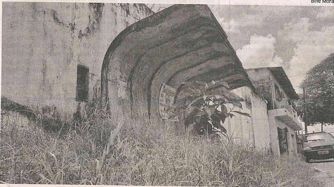
Parada de ônibus está cercada por mato, impossibilitando usuários de coletivos de permanecerem no local

“A situação é muito complicada. A gente fica sem ter para onde correr, pois temos de escolher entre ficar no mato e não se molhar ou pegar chuva, sem ser incomodado pelo mato, que passa da altura dos joelhos”