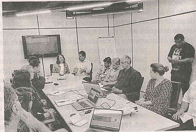
Membros do Governo e do Sinduscon discutiram venda de imóveis

Foi esse o tema da reunião do governo com o Sinduscon-MA, se-