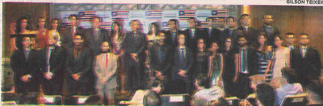
Solenidade de posse dos novos policiais civis aconteceu no Palácio Henrique de La Rocque