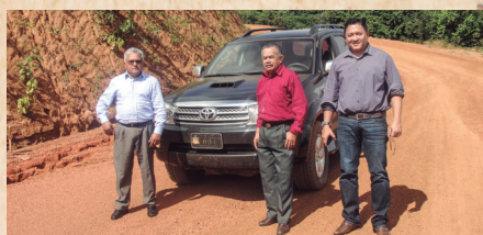
No interior do MA, em correição (2015)

De 2013 a 2017, dentro das suas funções institucionais, a Corregedoria realizara, como nunca se fez antes, 145 correições minuciosas de Promotorias de Justiça, envolvendo coleta de dados e informações in loco (trabalho interno e externo à Promotoria), e análise e avaliação à distância; e 215 inspeções de Promotorias e Procuradorias de Justiça. Foram, portanto, 360 correições e inspeções desde 2013. Vale ressaltar que, pela primeira vez, tinham sido inspecionadas as 31 Procuradorias de Justiça. Além disso, realizaram-se várias sindicâncias, parte delas resultando em sanções aplicadas pelo Corregedor-Geral ou sugeridas ao Procurador-Geral.