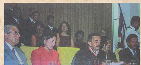
Posse como Procurador-Geral (2000)

Primeiro colocado na lista tríplice de integrantes da Instituição resultante da eleição realizada no ano 2000, foi nomeado Procurador-Geral de Justiça para o biênio 2000-2002, tomando posse a 12 de junho daquele ano.