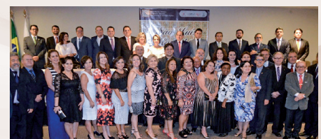
Redação e Fotos: CCOM-MPMA