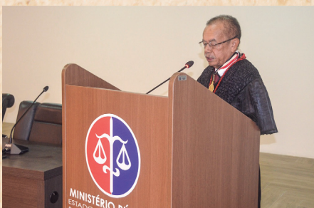
O último discurso (17-04-2017)

E foi categórico: quanto ao aspecto disciplinar, não hesitara na apuração das faltas cometidas por alguns e no enfrentamento de casos preexistentes que maculavam demais toda a Instituição.