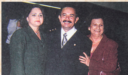
Posse como Procurador-Geral (2000)