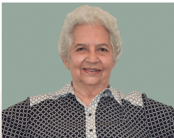
HELENA BARROS HELUY Procuradora de Justiça aposentada