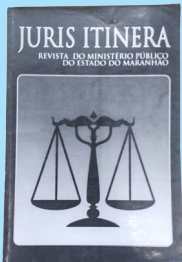
Revista do MPMA, criada em 1992