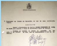
Primeira nomeação para o cargo de Procurador-Geral de Justiça, 1989