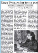
Notícia jornalística da posse, 1989 (jornal O Imparcial, 07.10.89)