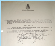
Segunda nomeação para o cargo de Procurador-Geral de Justiça, 1990

"Por ocasião da promulgação da Constituição Estadual, em 1989, o governador Cafeteira me convidou para a elevada função de Procurador-Geral de Justiça e fez a comunicação do ato em plena Assembleia Legislativa. O governador Cafeteira disse que estava praticando o primeiro ato de respeito à Constituição Estadual, que estava sendo promulgada, porque, a partir da Constituição de 1988, o Procurador-Geral de Justiça tinha que ser um integrante da carreira."